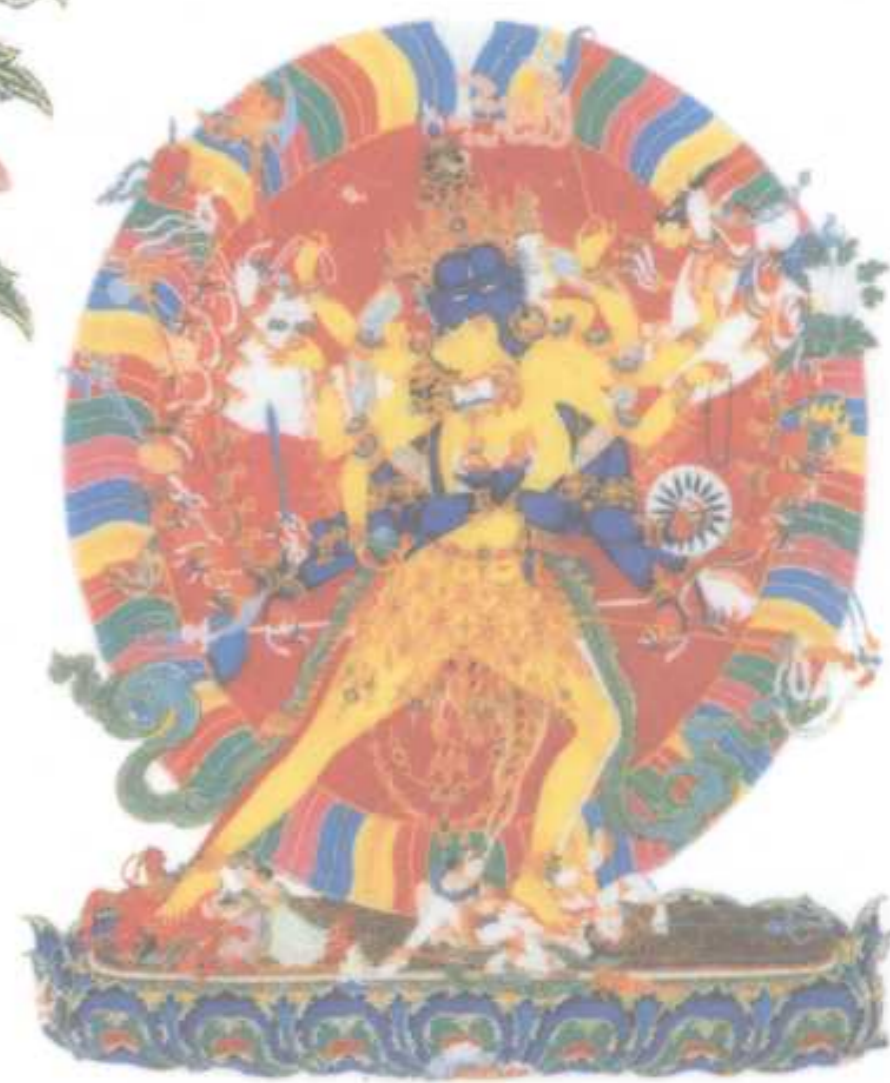
密宗真理最完美显现者 ——时轮金刚 引导众生脱离迷界的不二 续本尊