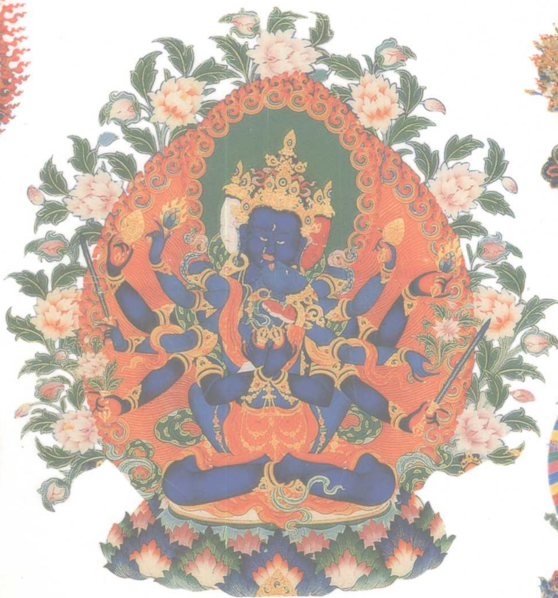
无上瑜伽密续之王——密集金刚 转化贪、嗔、痴、慢、疑等 五毒为五种智慧