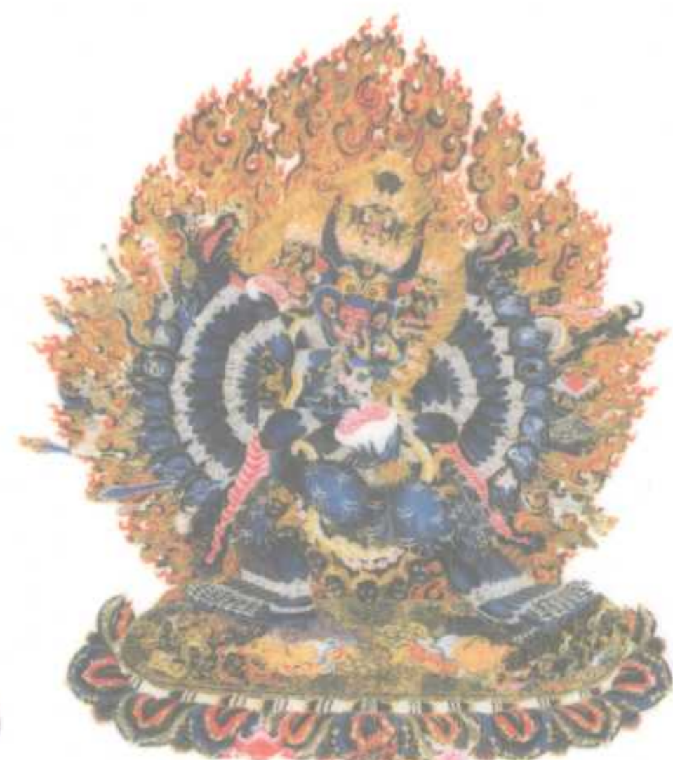
密续死亡征服者 ——大威德金刚 能驱除死亡，克除嗔怒 的父续本尊