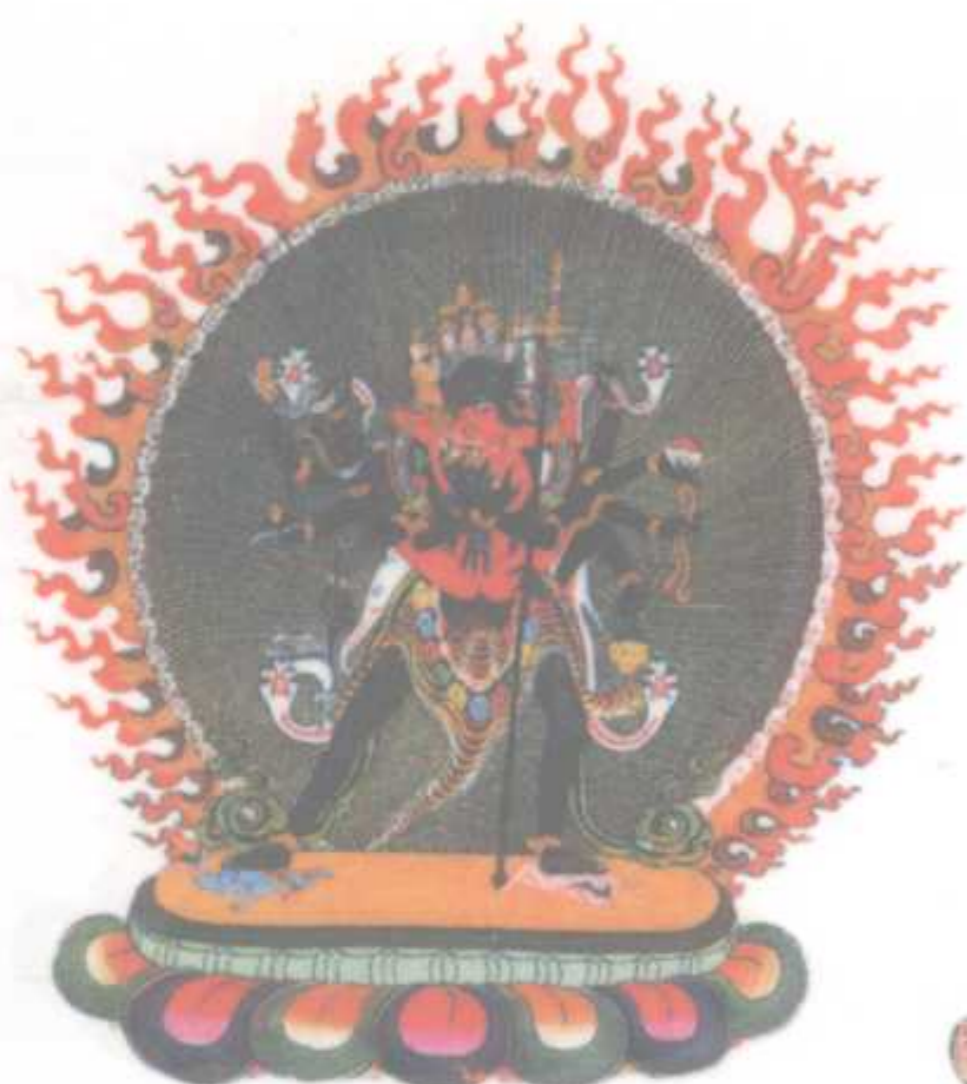
无上瑜伽母续本尊之首 ——胜乐金刚 消除贪毒，驱除成佛障碍 的母续本尊之首