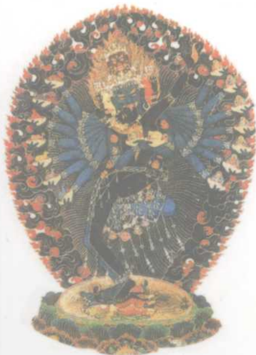
无上瑜伽身心合一本尊 ——吉祥喜金刚 洞悉自我执迷，使身心合一 化解一切对立的母续本尊