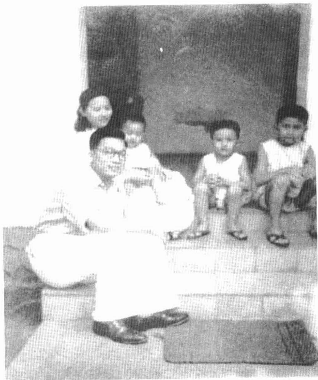
萧、妻及他们抚养长大的妻弟们(摄于1942年)