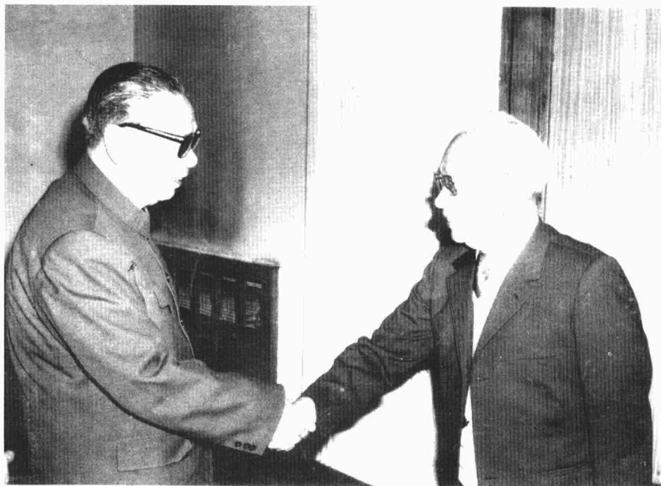
萧与中华人民共和国副总理姬鹏飞(1981年10月)