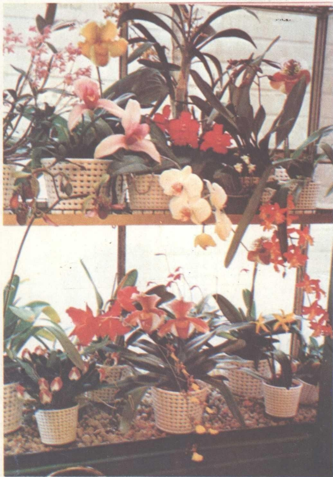
阳台双层架花卉布置