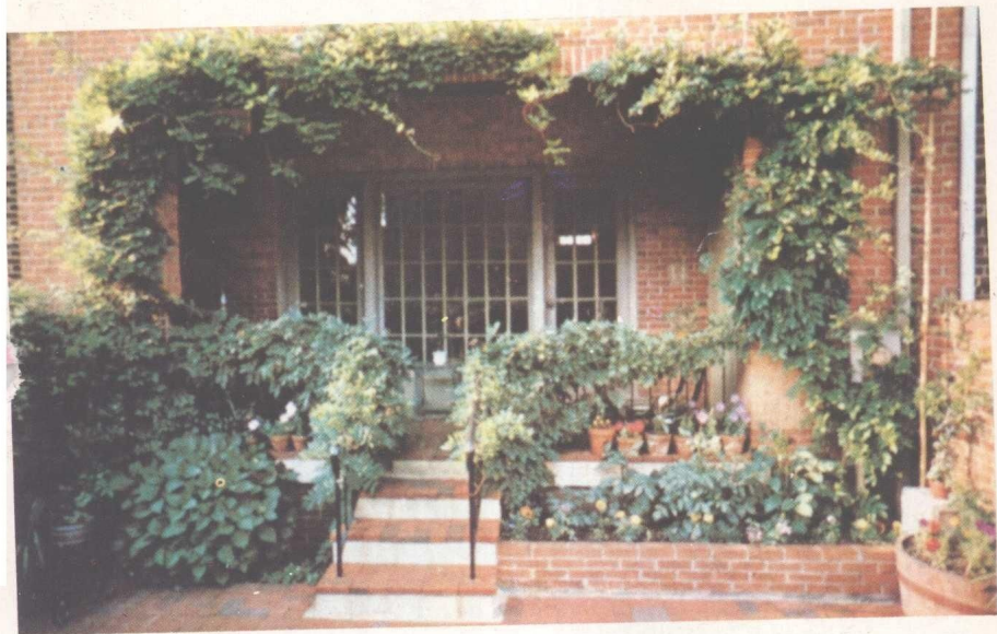
一楼平台花卉植物的布置