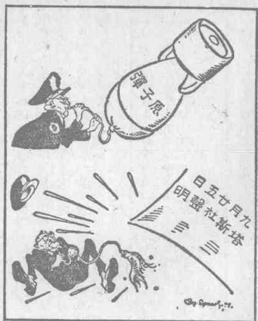
原子彈獨佔的幻滅

放光彩，他未免抖抖索索，發了急，只想打仗，再看他規定的一九四九年到一九五〇年，一年中國家的費用有四百十三萬萬美元，內中軍事的費用有三百八十四萬萬美元，這軍事費用中很多的錢是用來製造原子彈的。最近，他又一面開來艦隊霸佔我們台灣，一