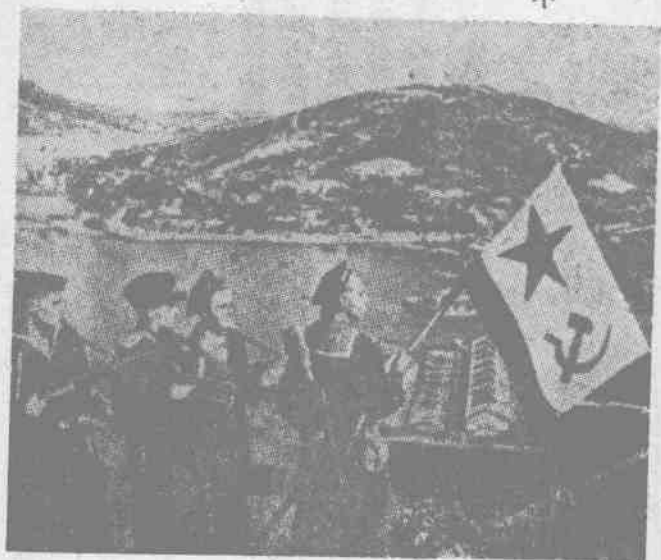
一九四五年八月蘇聯紅軍解放旅順口