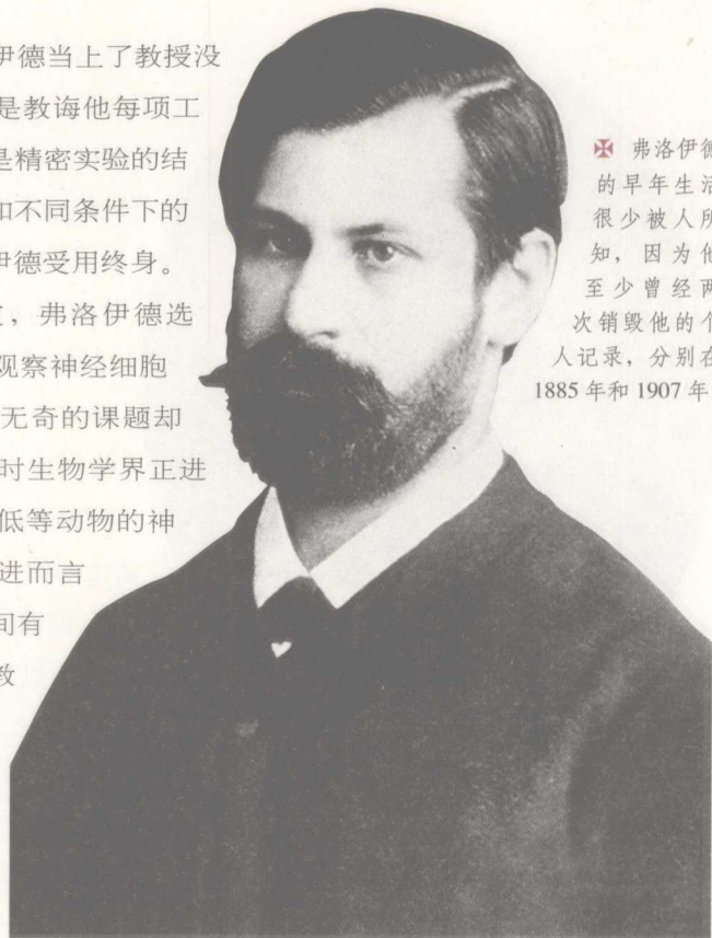
✦ 弗洛伊德的早年生活很少被人所知，因为他至少曾经两次销毁他的个人记录，分别在1885年和1907年。

在布吕克教授的实验室，弗洛伊德选择了一项工作：在显微镜下观察神经细胞的组织结构。这个似乎平平无奇的课题却是牵动科学界的大问题。当时生物学界正在进行一场大论战：高等动物与低等动物的神经系统之间有无根本区别？进而言之，人与动物的神经系统之间有无根本区别？传统哲学与宗教认为有，因为有实质区别，人才能称为万物之灵，现在弗洛伊德决心用科学来澄清这个问题。