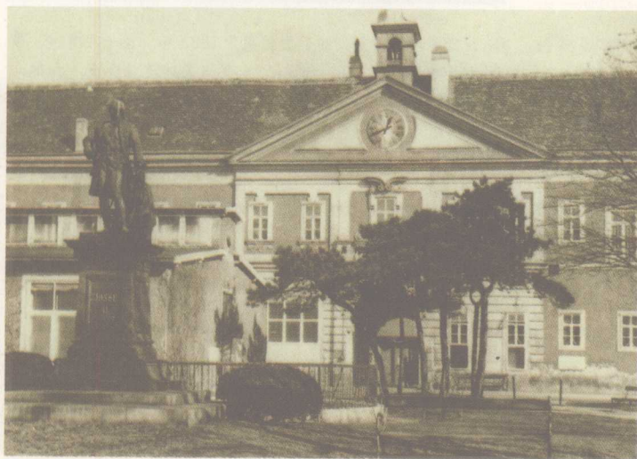
✘ 1882年，弗洛伊德进入维也纳总医院，在维也纳大学教授诺特纳杰手下当实习医生。

他将发现告诉了他的一个朋友，由那个朋友亲自进行手术并且宣布了，他根本没有提弗洛伊德的名字。因为研究可卡因，弗洛伊德还很可能成了西方第一个吸毒者，他又将可卡因推荐给他的朋友，使他上了瘾，为