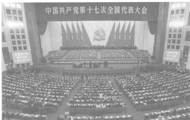
中国共产党第十七次全国代表大会在北京人民大会堂隆重开幕。

义制度。在经济领域，始终采取灵活的市场竞争和宏观调控相结合。这种国家体制，具备统筹安排、集中指挥、有效宏观调控全盘国民经济的能力，是西方任何国家都无法做到的。目前，我国并没有发生金融危机，只是受到了它的严重影响。也就是说，自家田地里的根苗并没有烂，只是外边的蝗虫飞过来了。我国经济的基本面是好的，已呈现出增长较快、结构趋优、效益提高、民生改善的特点。工业化、城镇化、市场化、国际化这“四化”已成为支撑我国经济增长的强大力量。