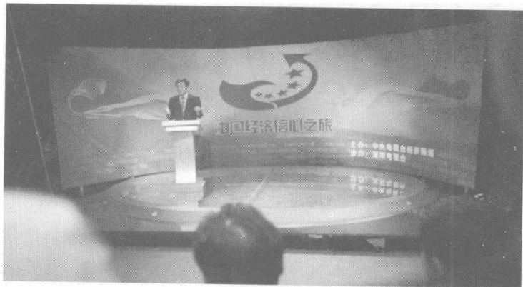
《中国经济信心之旅》深圳站现场

党的领导是克服危机的根本保证。对这次金融危机，党中央见事早、行动快。比如：2007年12月的中央经济工作会议，就明确地提出了防过热、防通胀、重民生的“两防一