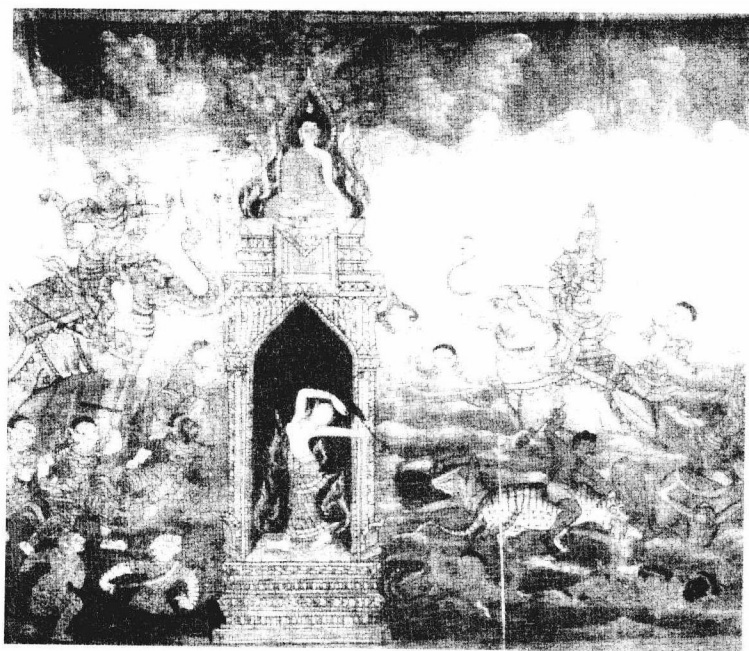
佛陀在菩提树下悟道时,以如意通降伏 魔军,并圆满具足六种神通