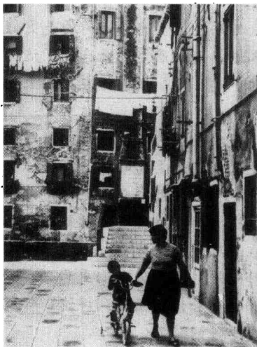
图1 无论你去哪儿，国内还是国外，摄影的挑战性可满足人们的愉悦之感和完成欲。这幅街景的照片是在意大利威尼斯捕捉的。

中见到的照片对你会发生影响，但这并不等于照样复录。每一个摄影者无时无刻不在受影响，但影响可被吸收，可转化为个性的一部分。没有两个人对事物的观察是完全一样的。