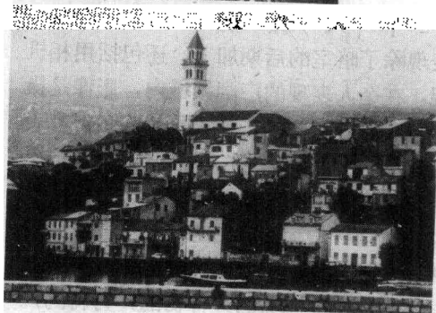
图8 这幅照片映示南斯拉夫海岸的一个城镇,象那样的风景照片是传统性的,同时又有美学特性。

可以挑剔的,当然除非它开始使你生厌。要是那样的话,就在新颖异常的光照下,探寻观察风景、海景和城景的方法。这意味着尝试新的拍摄角度,试用独特的滤镜和胶片,试试更为大胆的构图,以便进行其它饶有趣味的试验。同样,变换一下手法也适用人像摄影和其它大多数摄影门类。