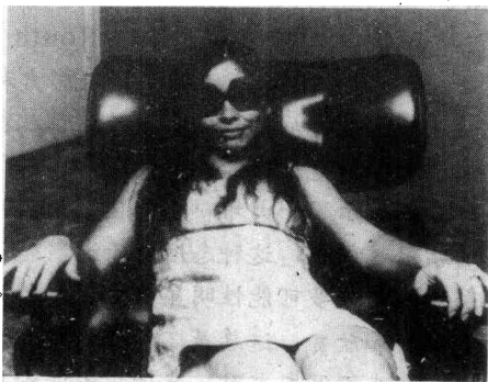
图2 在拍摄中倾注你的感情，然后毫无顾忌和不落俗套地估价自己的照片。一丝不苟的抓拍照片自有独特的效果。

我见到好多照片以某种理由被吹捧成“杰出”的创作，但实际上却很低劣，有时甚至是冒牌货。这就说明，摄影评论的语言要是从其它自我表现的艺术形式的评论演变而来，就容易把人搞