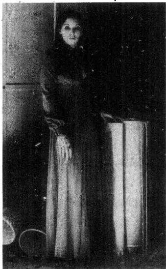
图3 这幅照片是艺术还是冒牌艺术？只要照片使你欢愉，不必插上什么标签。

糊涂。评论家、艺术馆馆长、美术馆馆长有权称颂有深度的照片，也有权赞扬下乘之作；只要他们认为合适，就可进行褒美或贬抑。摄影家可自由以传统或新奇的形式，展出那些荒诞或庄重的作品。虽然，有些观赏者能敏锐察觉欺骗性的照片，可他们还得开放思想。你自己努力思考吧。为了避免肤浅，你必须首先能识别什么是肤浅。