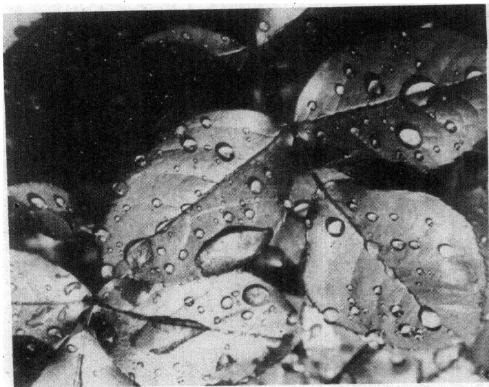
图6 美丽的图案，形成和影调之间的关系，能激发想象力，这可在刚被一阵雨淋过的叶片上体现出来。