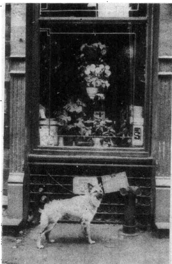
图5 这幅照片曾被忽略，以后我才发现，并加以赞赏，因为这时我的审美价值观念改变了。

的摄影手法怀有信心。先学拍传统型的照片，然后开始试验。为崭新的形式、构图、符号和关系而激活你的思想和情感。多而不精没有什么坏处，失败恰恰能使你悟出一些手法来。