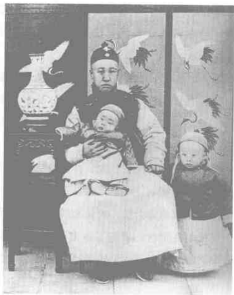
末代皇帝溥仪同 父亲载洵亲王和弟弟

为皇太后而长期垂帘听政，执掌清廷大权。深得其中奥秘的载沣，在毫无思想准备的情况下，突然听到慈禧的宣布，好似当年其父奕譞听到慈禧宣布载湉去当皇帝一样，惊吓得如呆人一样。但一旦清醒过来，立即伏在地上连连叩头，“叩辞圣再”。他认为，国家处于多难之秋，应立长君为好。而内心里，他的二哥载湉名为皇帝实为囚徒的下场，实在令他寒心，他怎肯让自己的亲生儿子再去当光绪第二呢？