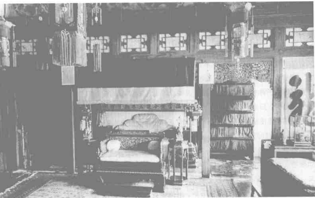
同治元年（1862）十一月初一日，慈禧与慈安正式垂帘听政。图为垂帘听政之处——养心殿东暖阁

子袭，要降爵位一等。因此，还可加以儿子袭位时不按祖制降爵的颁赐。这种特殊恩宠称为“世袭罔替”，意思是子孙世代承袭王爵，而不必按例降袭。而奕詝就荣幸地得到了这种少有的特大恩赐。死后又谥为“贤”，这就是后人所习惯地称为“醇贤亲王”。