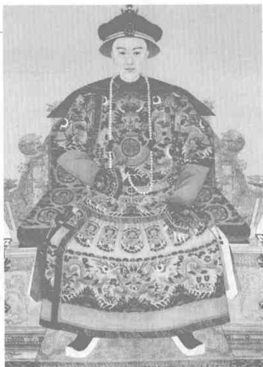
光绪帝受新觉罗·载湫

同治十三年（1875）十二月五日，做了十三年傀儡皇帝的同治帝病死。慈禧丝毫不为其子早逝而痛心，她为了重掌操纵朝政的“可倚”之托，宣布以奕譞之子载湫“承继文宗显皇帝（咸丰帝）为子，入承大统为嗣皇帝”。以至当时深知宫廷争斗复杂而尖锐的奕譞，竟吓得魂不附体，当场“碰头痛哭，昏迷伏地，掖之不能起”。奕譞以极大的不安与惊恐，面对着意外飞来的“洪福”。他历经咸丰、同治两朝，富有政治经验。对于妻姐慈禧的为人，他了解得愈来愈深透了。他认为，自己的儿子只不过当了个名义上的皇帝，实际是进入了危险可怕的虎口，随时都可能丧生，甚至会祸及全家。