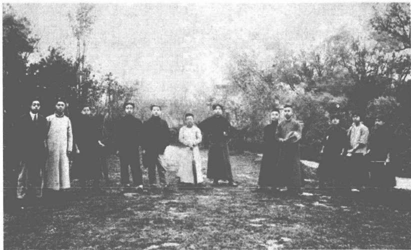
1918年4月14日，毛泽东与蔡和森发起创建新民学会， 图为毛泽东与新民学会部分会员

再回到1919年9月1日的《问题研究会章程》。毛泽东在列了一大堆问题后，也没有一掷了事。除了寄给朋友参考外，他自己对其中的一些问题则继续思考和研究。例如，《章程》中列有国语（白话文）、编纂国语教科书等问题，在9月5日给黎锦熙的信中，毛泽东便表示要研究“国语”，认为必须“将国语教科书编成”；还说，“关于‘国语’的材料，先生遇着，千万惠给一点”。《章程》中有一项关于恋爱自由的问题。恰巧长沙有一个叫赵五贞的女学生，因不满