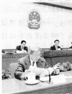
全国人大常委会审议法律提案