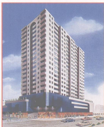
廣州東環商廈(自置產業七樓)

南源永芳集團有限公司:香港中環德輔道中121號遠東發展大廈804室 電話:00852-25446541 傳真:00852-25449847