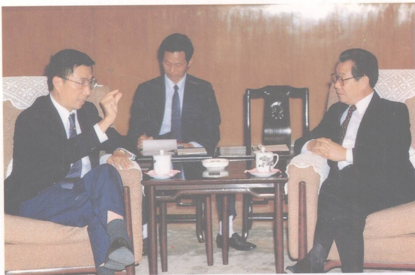
李瑞環會見丁肇中