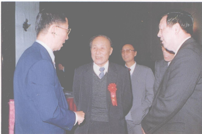
新華社原社長、《瞭望》週刊社社長穆青等與丁肇中在一起交談