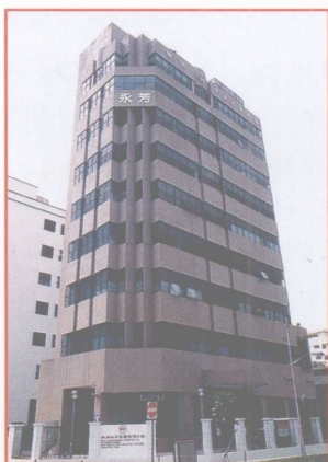
新加坡南源永芳大廈