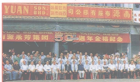
南源永芳集團有限公司馬來西亞總部

本集團公司目前正向高科技等方面努力拓展,衷心希望今後一如既往,不斷得到海內外各界人士的關心、支持和幫助。