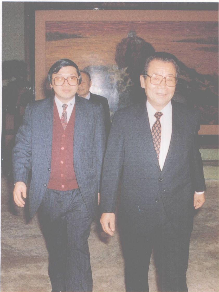
李瑞環和姚美良在一起