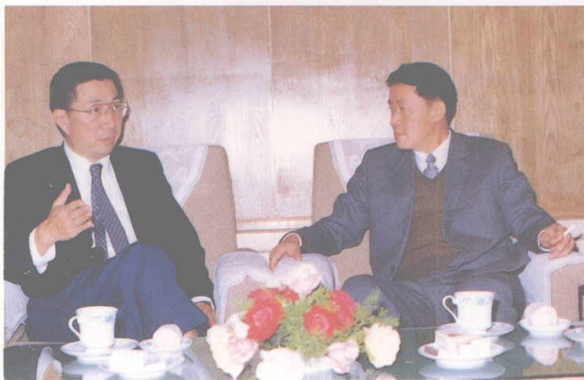
新華社社長郭超人與丁肇中博士親切交談