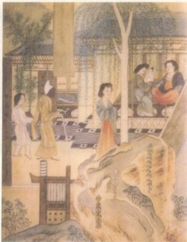
得医图 生动再现了盛唐时期 医生出诊的场景

纲领的“望闻问切”四诊法,是扁鹊在融合前人理论以及自身临床经验的基础上,首次运用于临床诊治中的;他在砭石(古代治病用的石针)基础上改革而成的金属针,用于针灸治病,留传袭用至今,奠定了中医针灸疗法的基础;而将中药制成丸、散、膏、丹、汤剂等多种品类,同样也是扁鹊的创造性发明;相传他还是中医史上最早实施外科手术和麻醉术的医生,有名的“换心手术”的故事就源自扁鹊。