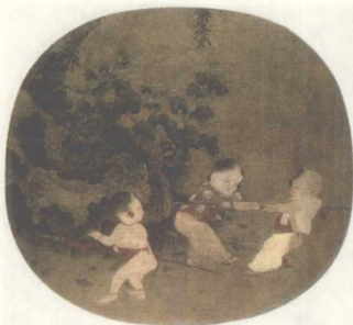
秋庭婴戏图 南宋 扁鹊游医至秦国时，专 为幼儿治病。

“依仗权势，骄横跋扈者不治；贪图钱财，不顾性命者不治；暴饮暴食，饮食无常者不治；病深不早求医者不治；身体虚弱不能服药者不治；相信巫术不相信医道者不治。”