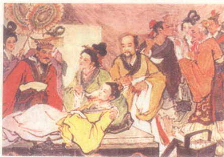
扁鹊治魏国太子图

睛”，而是他首创的“望闻问切”四诊法。“望闻问切”是扁鹊在总结前人医术的基础上，创造出来的通过望（看气色）、闻（听声音）、问（问病情）、切（按脉搏）诊断疾病的方法。四诊法中，扁鹊尤其擅长“望”诊和“切”诊。