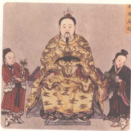
清·《先医神像册》扁鹊像

战国时期，如同中华医史上的分水岭。在此之前，传统中医领域中留名后世的医者寥寥无几；而在这之后，中医领域逐步呈现出空前繁盛的景象，民间医学生机勃勃、名医辈出，中医逐渐形成了一门独立的学科。这一现象的出现，与生活在战国时的扁鹊有着密切的关系。