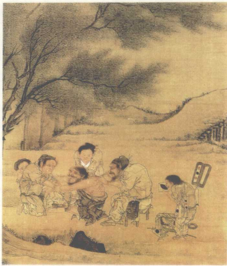
村医图 李唐 描述了走方郎中（村医）为村民治病的情形。

除了运用“四诊法”，扁鹊还善于运用针刺、按摩、热敷、手术和汤剂等多种方法治疗疾病。一次，扁鹊行医路过虢国，见到当地百姓面容悲伤，正为刚刚死去的虢国太子筹办丧事。他向宫中术士仔细询问有关太子发病的情况，推测出太子极有可能患了一种“尸厥”症（类似于昏迷），并没有真正死去。于是，他前往瞻望太子的“遗体”，俯身聆听和触摸后，发现太子还有微弱的鼻息，身体散发有余温。扁鹊立即断定太子还活着，遂禀报国君，愿为太子治病。只见他朝太子的百会穴上扎了几下，病人便逐渐苏醒过来；接着他在病人两胁下作了热敷，病人便奇迹般地坐了起来；又经过了几天的调补后，险些长眠地下的太子完全恢复了健康。