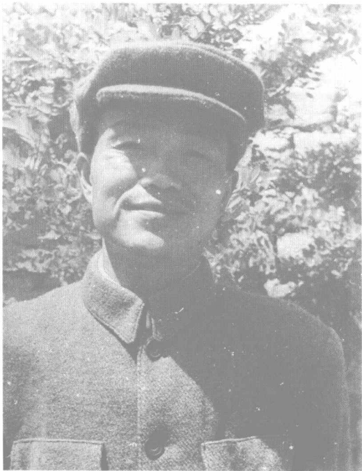
胡乔木,1948年任新华社总编辑,1949年任新华社社长。

有两件事不同寻常,引人瞩目。1950年1月20日,新华社发表长篇电讯:“中央人民政府新闻总署署长胡乔木,本日向新华社记者发表谈话,驳斥美国国务卿艾奇逊的无耻造谣。”斯大林问毛泽东,胡乔木何许人也,并说事情如此重大,不应该用这种方式。斯大林有所不知,这篇谈话是身在莫斯科的毛泽东于1月19日凌晨亲笔写就,用密码电报发回北京给“刘少奇并告乔木”:“用乔木名义写了一个谈话稿,请加斟酌发表”。 ① 过了一年半,1951年6月22日,《人民日报》以增出一张四个版面的办法一次登出长