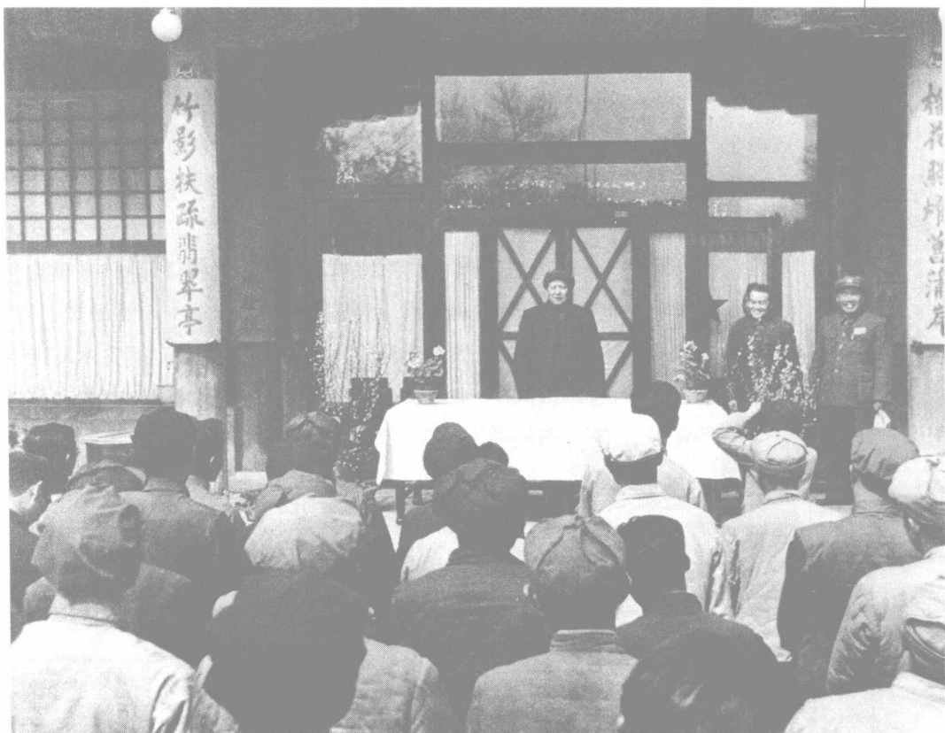
1950年4月13日,毛泽东在中南海颐年堂与出席全国新闻工作会议的代表会面并讲话。右一为朱德,右二为胡乔木。

词句的修改“实有点铁成金,出奇制胜之妙。” ① 11月,胡乔木又续作三首。以后,毛泽东与胡乔木在京杭两地又多次通过书信或电话交换意见,反复推敲。胡乔木的《词十六首》于1964年岁末最终由毛泽东定稿,1965年元旦在《人民日报》和《红旗》杂志第一期上同时登出。在全国政治界和文化知识界引起极大的注意和兴趣。