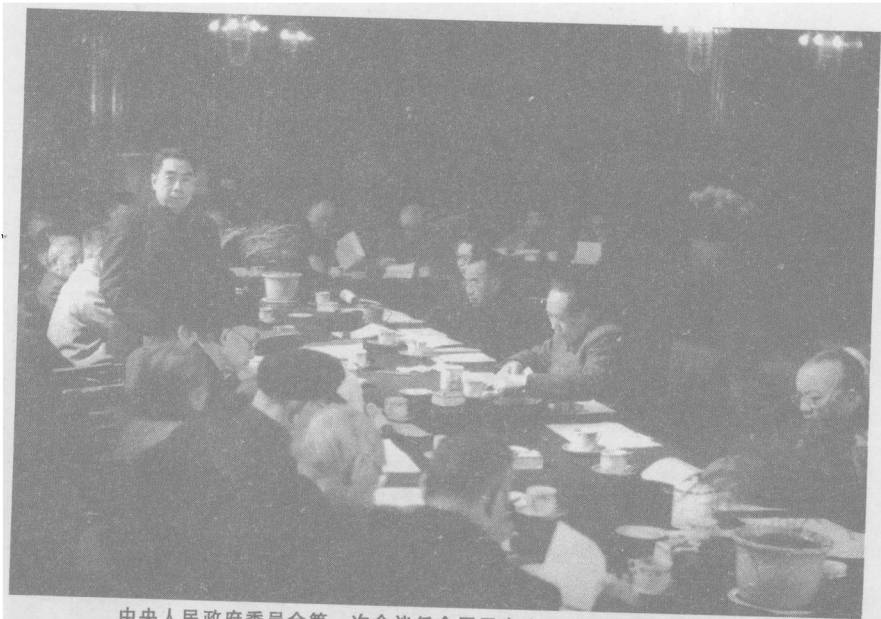
中央人民政府委员会第一次会议任命周恩来为政务院总理兼外交部长

这一天，中央人民政府委员会第一次会议任命周恩来为中央人民政府政务院总理。这项任命，党中央广泛地听取了多方面的意见，集中反映了中国共产党全党同志、各民主党派人士和人民团体负责人对周恩来的高度信任和支持，是人心所向，众望所归。