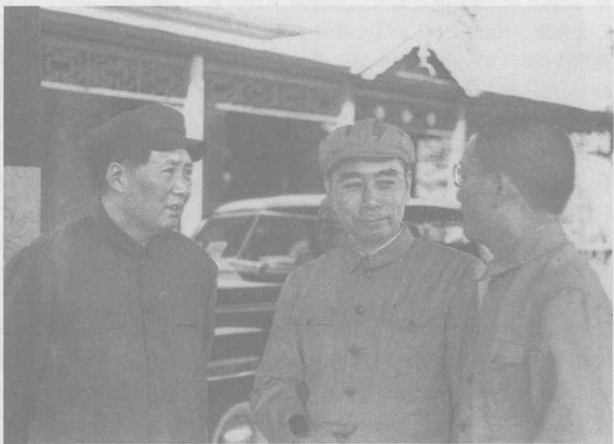
1949年8月,周恩来和毛泽东、张治中在北平火车站迎接宋庆龄

毛主席说,我赞成恩来的意见。对做过贡献的民主人士和各民主党派的领导人,应该在政府里安排适当的职务。