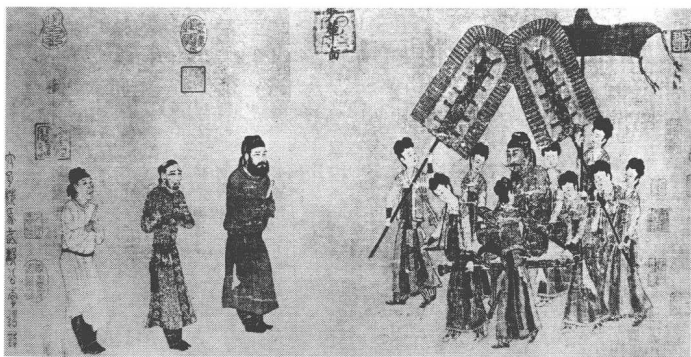
唐代画家阎立本绘唐太宗接见吐蕃使者

由于他聪明好学，这时已经学业初成，文采出众，从同辈少年中脱颖而出，在洛阳文坛上崭露头角。杜甫后来回忆说：当时的大文豪李邕都想要见他一面，诗人王翰希望能和他做邻居，中过进士的名士崔尚和魏启心甚至把他比作汉代著名的史学家班固和文学家杨雄。前辈的赏识增强了少年杜甫进取的精神和强烈的自信心，他傲气的眼神充满了优越感和对未来的自信。