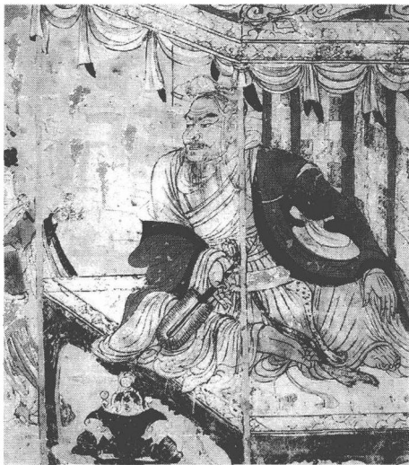
唐代壁画中的维摩诘画像

杜甫还练习书法，从九岁开始就写大字，创作的书法作品装满了一袋子。唐初的书法家虞世南是学晋代大书法家王羲之的，杜甫小时候曾临摹过他的书法。