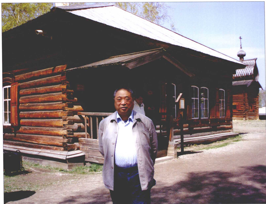
张永芳摄于俄罗斯伊尔库茨克