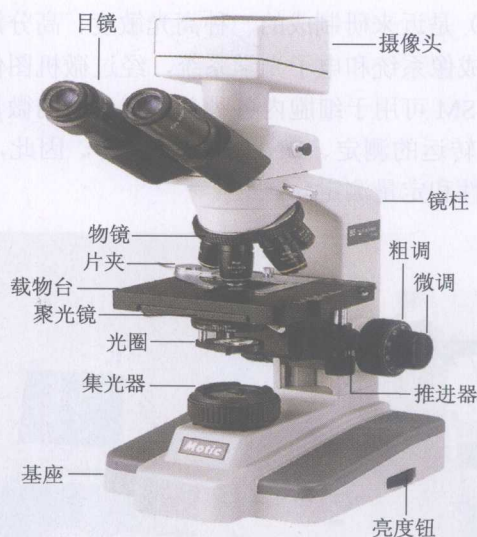
图 1-1 光学显微镜

最常用的染色法是用苏木精 (hematoxylin) 和伊红 (eosin) 染色, 简称 HE 染色。苏木精可将细胞核内的染色质和细胞质内的核糖体等染成蓝紫色, 伊红可将多数细胞的胞质染成粉红色。因苏木精为碱性染料, 能被其染色的结构称嗜碱性 (basophilia); 伊红为酸性染料, 能被其染色的结构, 称嗜酸性 (acidophilia)。对碱性和酸性染料的亲和力均不强, 称中性 (neutrophilia)。