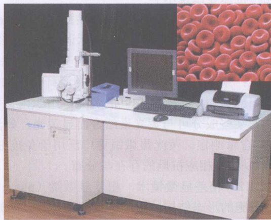
图 1-4 扫描电子显微镜

1.3.2.1 透射电镜术 即应用透射电镜 (transmission electron microscope, TEM) 观察细胞内部的超微结构 (图 1-3)。一般采用戊二醛或锇酸作固定剂, 合成树脂包埋, 在超薄切片机