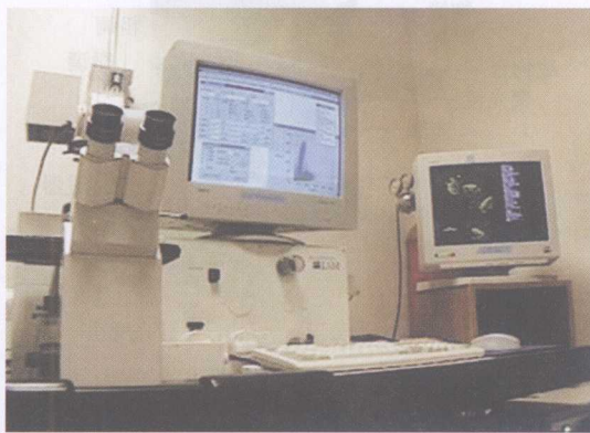
图 1-2 共聚焦激光扫描显微镜

microscope, CLSM) (图 1-2) 是近来研制成的一种高光敏度、高分辨率的新型生物学仪器。它以激光为光源, 采用共聚焦成像系统和电子光学系统, 经过微机图像分析系统对组织或细胞进行二维和三维分析处理。CLSM 可用于细胞内各种荧光标记物的微量分析、细胞的受体移动和膜电位变化、酶活性和物质转运的测定、DNA 精确分析等, 因此, CLSM 可更准确、快速地对细胞内的微细结构进行定性和定量测定。