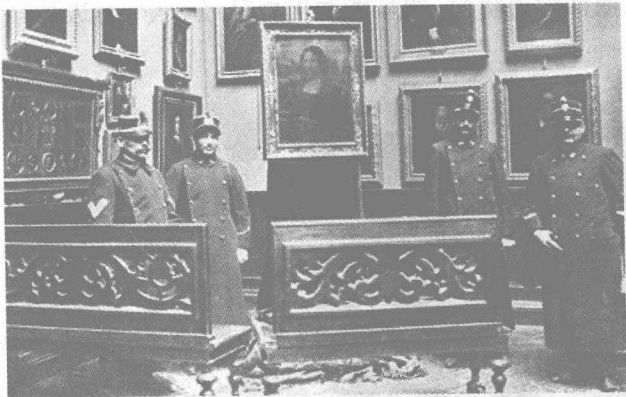
警方找回《蒙娜丽莎》

该画于12月31日到达巴黎。人们聚集在火车站,盼望能一睹芳容。1914年1月4日上午,她被送还给卢浮宫沙龙艺术展览厅。那个星期天,巴黎人排起长队买票欣赏他们的《蒙娜丽莎》。著名小说家科莱特在《晨报》的专栏里描绘了当时的情景。科莱特写道,要见《蒙娜丽莎》并不容易。大多数参观者都“全副武装”,带着照相设备。在参观过程中镁光灯不停地