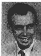
J.D. Watson 沃森(1928~)