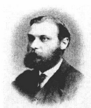
W. Flemming 弗莱明(1843~1915)

摘要： 本章从细胞和分子两个方面介绍了遗传的物质基础。在遗传的细胞学基础中，重点介绍了细胞的基本结构、染色体的形态、数目、结构以及染色体在细胞分裂过程中的行为。在遗传的分子基础中，重点介绍了核酸作为遗传物质的间接证据、直接证据、DNA 结构发现的过程、DNA 双螺旋结构的特征和 RNA 的结构，同时对左旋 DNA、三链 DNA、四链 DNA 等核酸结构方面的研究进展作了综述。