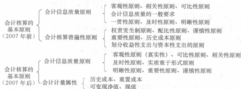
图 1-1 会计核算的基本原则

会计原则是指会计中最基础、最理论性的东西,如权责发生制原则、谨慎性原则等,2007年前后我国在会计核算中执行的会计原则有着明显的变化。会计核算的基本原则如图1-1所示。