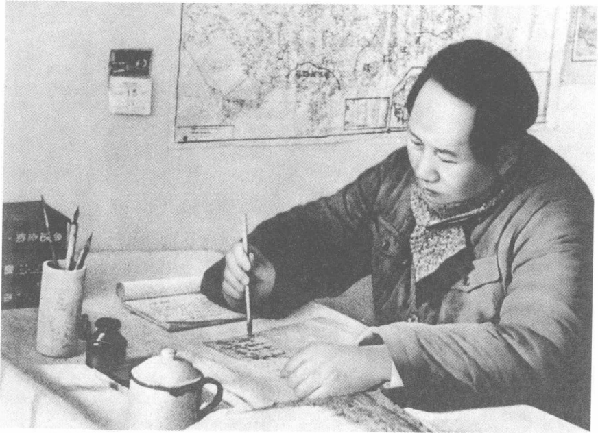
毛泽东在枣园窑洞工作（1946年）