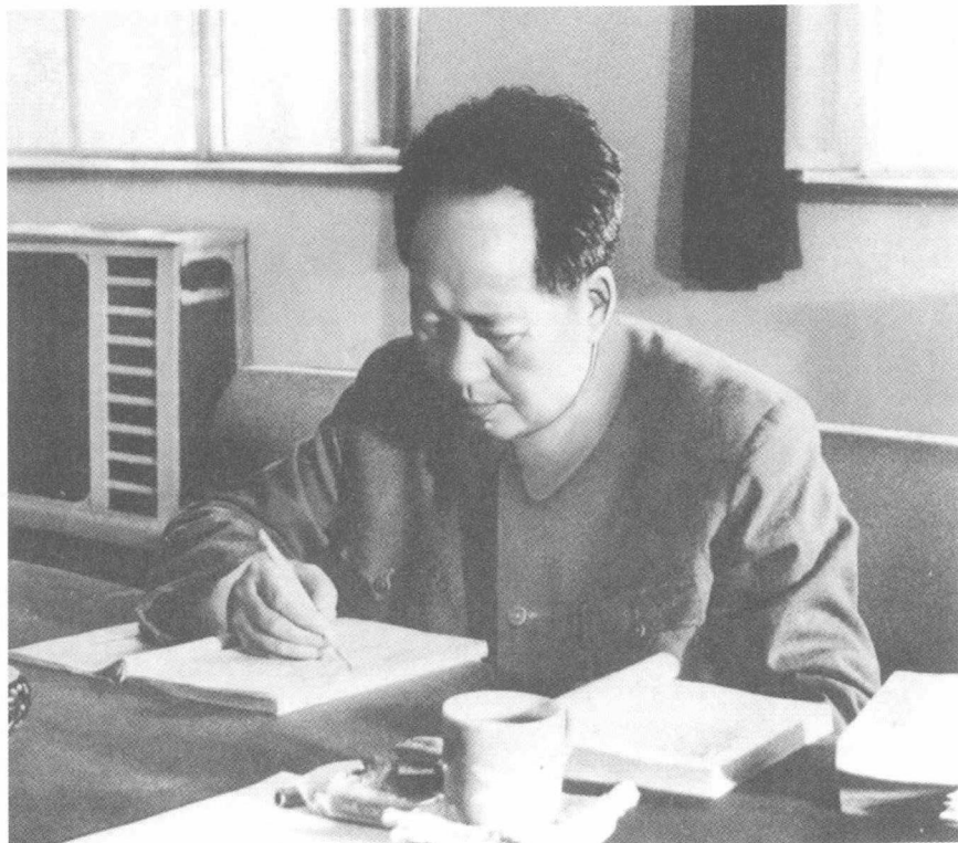
毛泽东在修改宪法草案（1954年1月）