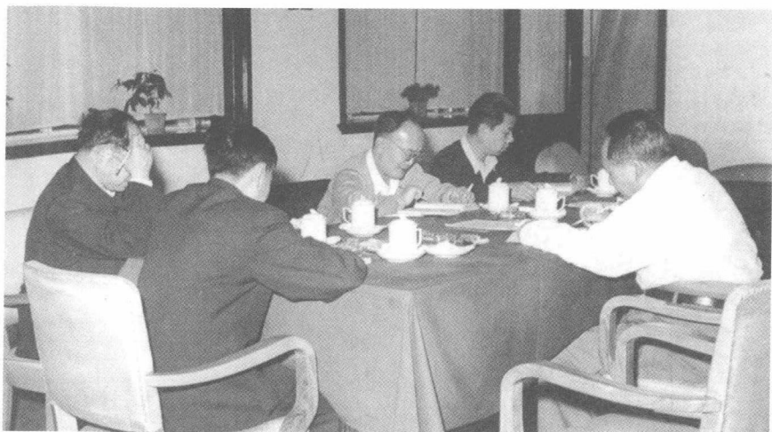
毛泽东与胡绳、田家英等一同研读苏联《政治经济学（教科书）》第三版（1959年12月至1960年2月）