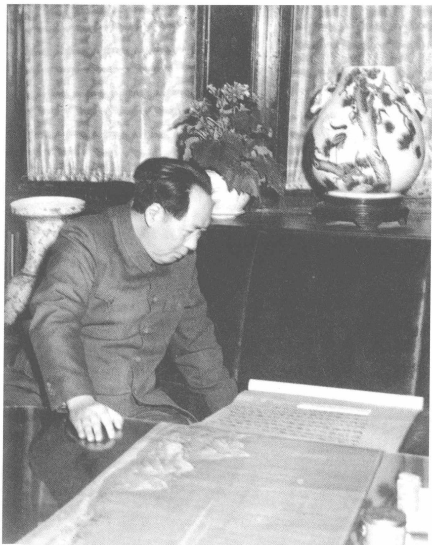
毛泽东观察中国国画（1953年）