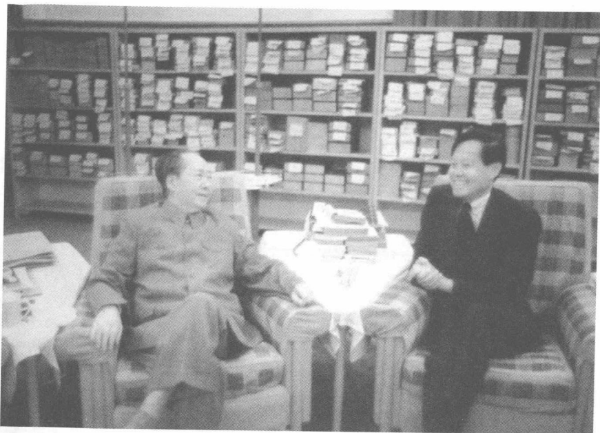
毛泽东在中南海会见美籍物理学家杨振宁（1973年7月）