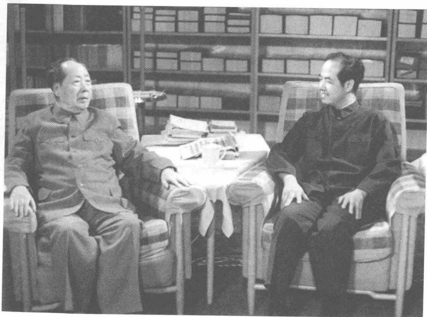
毛泽东在中南海会见美籍物理学家李政道（1974年5月）