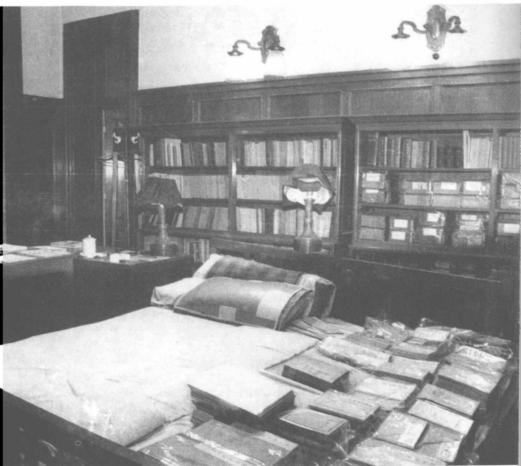
毛泽东在中南海的卧室