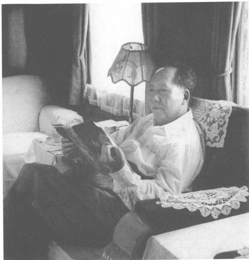
毛泽东在火车上看书（1962年）