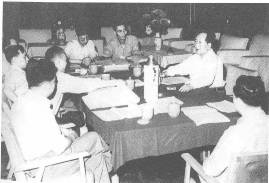
毛泽东在广州和有关同志研究《毛泽东选集》第四卷的编辑工作（1960年4月）