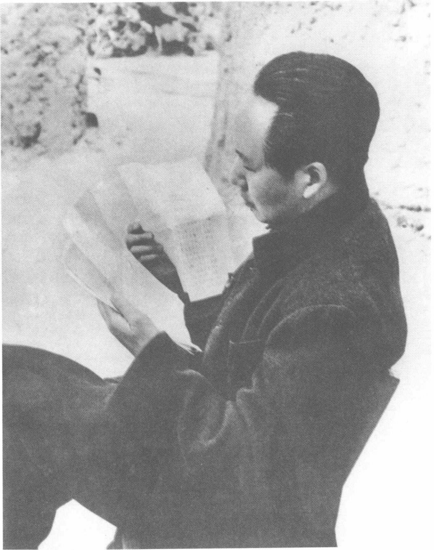
毛泽东在审阅文件（1946年）