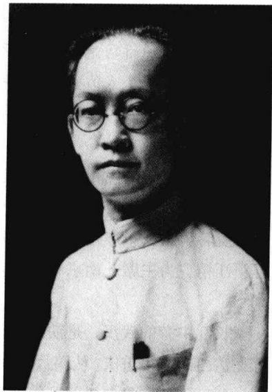
被蒋介石囚禁的立法院院长、国民党元老胡汉民。

一年后，张恨水完成的《金粉世家》也被多次改编，70多年后的2003年，40集电视剧《金粉世家》再次登上荧屏，以平均7.68%的收视率成为两年间中央电视台八套收视率最高的电视剧。