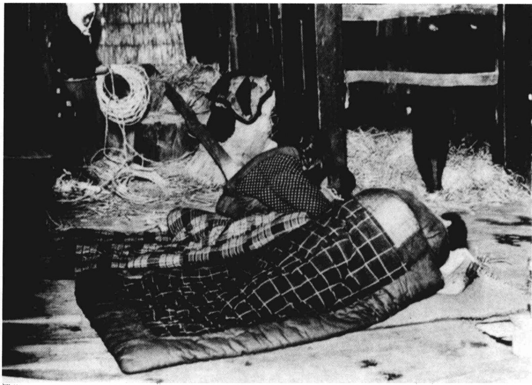
1931年日本青森贫苦农家。

依赖出口的日本，遭遇重创。被削减了四成工资的纺织工人走上街头。一个工人甚至爬上40米高的大烟囱，大喊要为工人加薪水，他在烟囱上呆了130个小时。这一年，日本的失业人数高达250万以上。当时流行着一句话：“大学