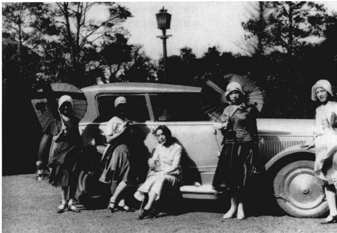
日本时髦的姑娘们。