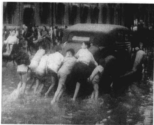
1931年，大水泛滥长江流域。图为浸泡在水中的武汉。(上) 大水中的人们。(下)