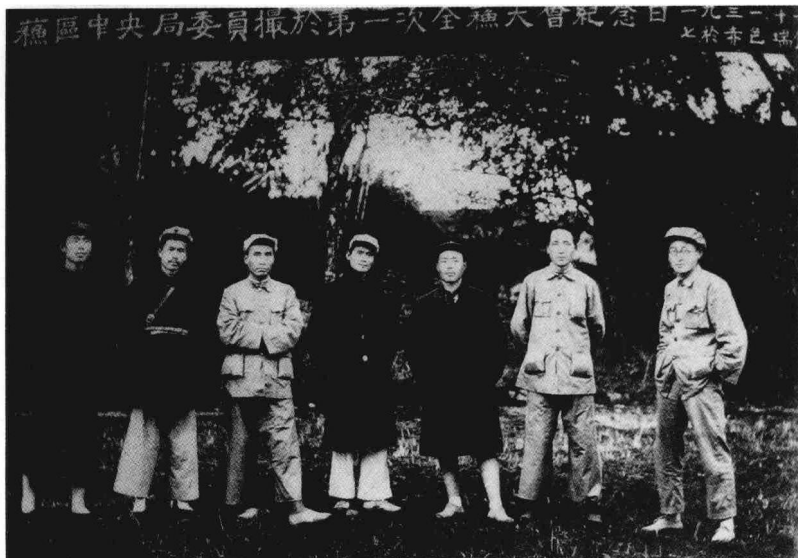
1931年11月，中华苏维埃共和国成立，毛泽东当选主席。图为苏区中央局委员合影（右二为毛泽东，右五为朱德）。

当年的一份人口调查表明，1931年中国的人口是4.2亿，农业人口占85%。38岁的毛泽东觉得这里蕴藏着一股沉默但巨大的力量。他在对兴国县八户农民调查以后，得出了结论：