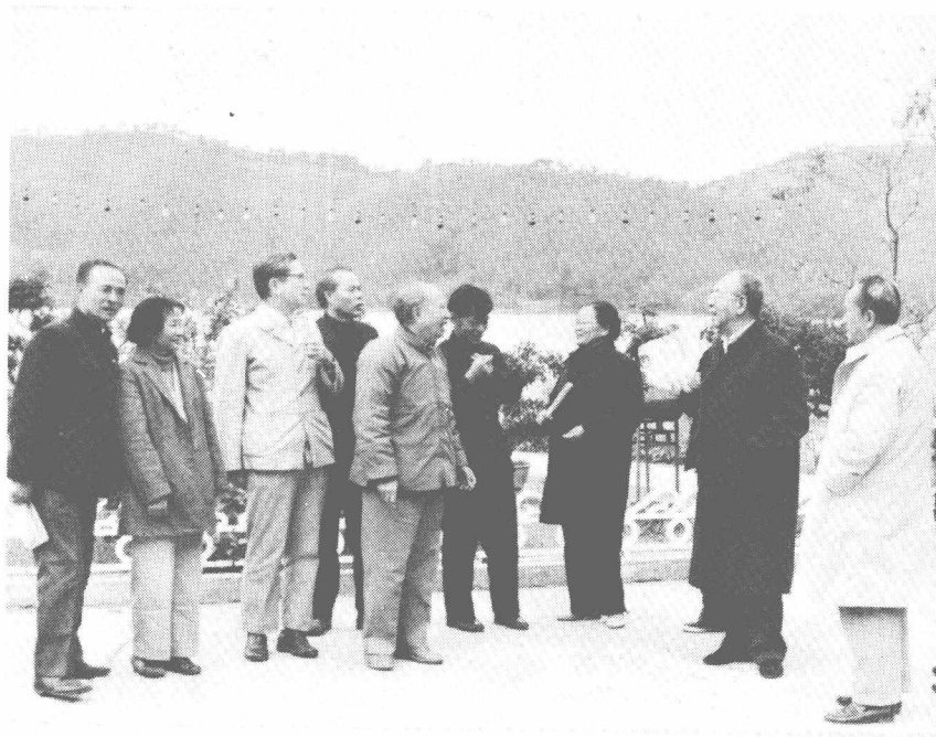
1985年作者夫妇(右起 第三、四人)参加广州南湖 《一代风流》讨论会