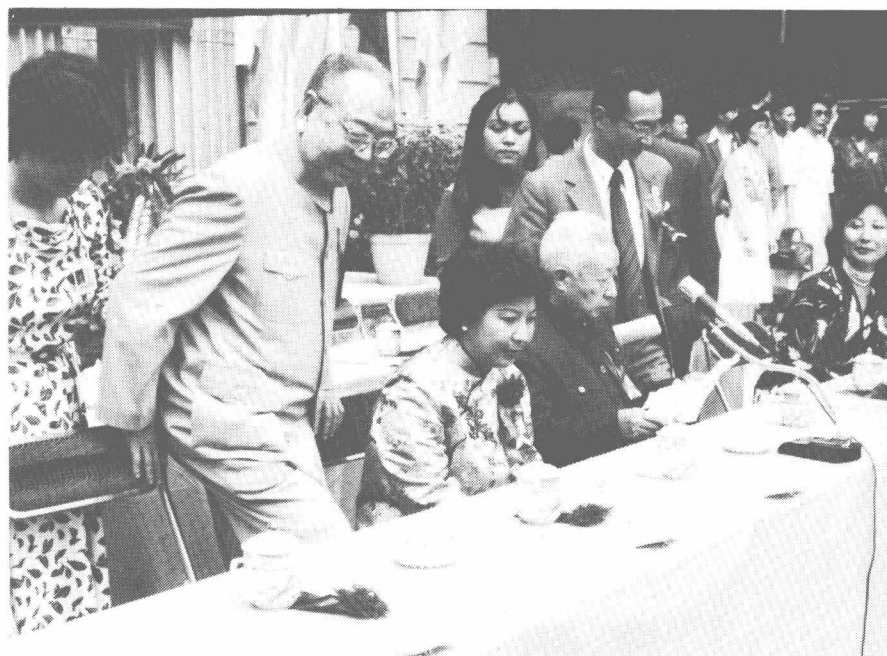
作者参加孙逸仙纪念医院命名典礼(1985年)