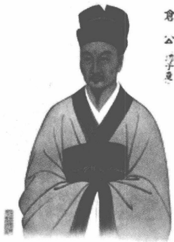
图 1-1-2 脉诊医案——神医仓公

脉，治验脉案均有笔录，后名为“诊籍”。由于他治学严谨，善于总结，在他收录的病案中，已出现 19 种脉象。亦称是脉学奠基人之一。