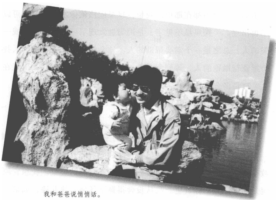
我和爸爸说悄悄话。

在很久很久以前，有一株开得很美丽的小花，她是一朵微笑的小花。白天的时候，花儿朝着太阳公公开放得很开心；到了晚上，太阳公公去睡觉了，花儿就朝着月亮婆婆开得很开心；如果哪一天月亮婆婆很忙没有出来，花儿就朝着远处村庄的灯火开得很开心；如果灯火也灭了，花儿就对着萤火虫开得很开心；如果萤火虫也没有来找花儿，她就闭上眼睛，想着太阳公公、月亮婆婆、灯火和萤火虫，依旧开放得很开心。