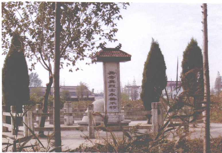
吴秀英烈士纪念碑