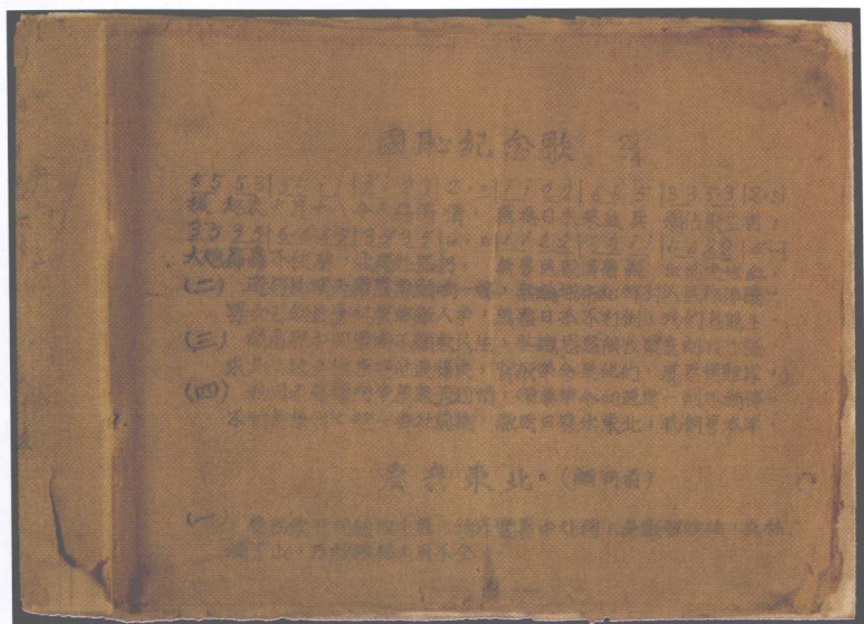
东北抗日联军歌集《国耻纪念歌》