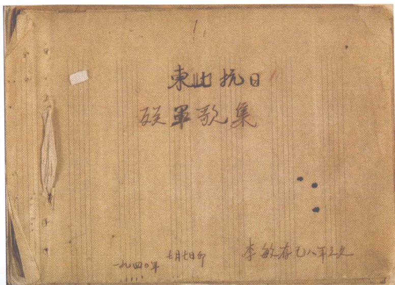
东北抗日联军歌集封面