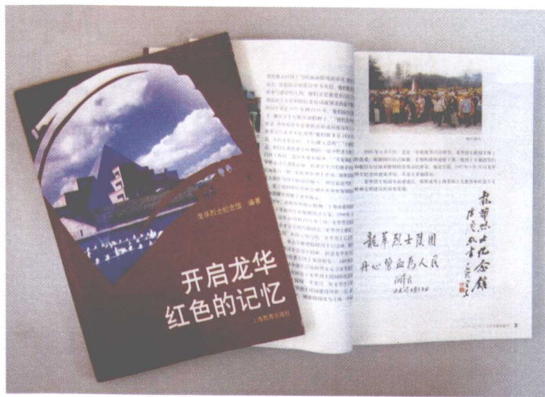
开启龙华红色的记忆