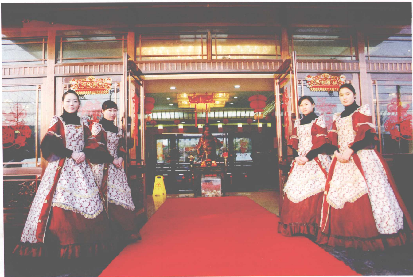
众口能调—婚礼喜宴

首先，确定结婚日期。以往的风俗，大喜之日由双方父母根据“皇历”、新人生辰八字等来挑选所谓的“吉日”。现在，喜日子一般都定在新人、亲戚、同事、朋友等大多数人都方便的时间，如双休日、节假日等。如果这一天阳历、阴历都是诸如2、6、8的“双日”，又赶上双休日，那么，你最好提前半年左右的时间去预定酒店，不然，到时候可能就定不到自己满意的酒店了。