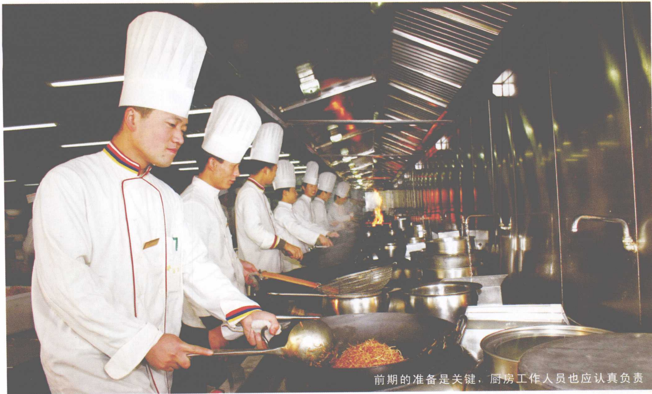
前期的准备是关键，厨房工作人员也应认真负责