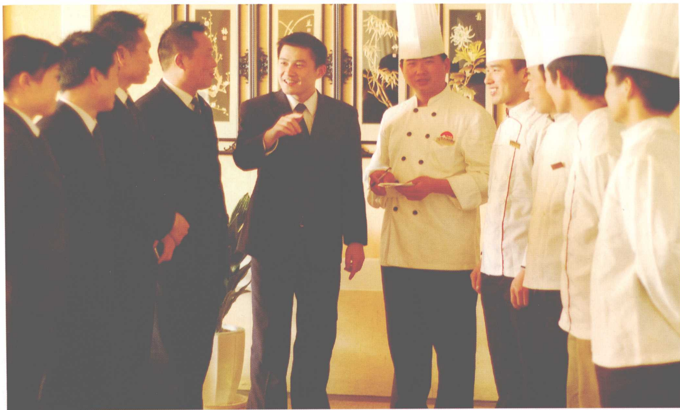
众口能调—婚礼喜宴