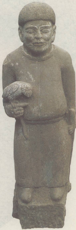
持海东青石俑 女真先祖像

天祐四年(907),也就是朱温灭唐建立后梁的那一年,阿保机取代了可汗痕德堇成为联盟首领。他称自己为“天皇帝”,他的妻子为“地皇后”。阿保机担任首领后,开始实行化家为国的举措。由于政权极为不稳定,他制定了一系列的对内和对外政策。