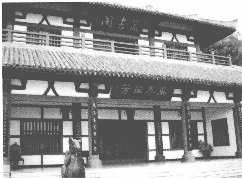
藏书阁里，似有浓浓的书卷气扑面而来……

第二展厅门首上悬挂的“并迁双固”匾额，是后人对陈寿史学成就的高度褒扬。“并迁”，是说他可以与史学大家司马迁并肩；“双固”，是说他可以与另一位史学大家班固成双，称其有“良史之才”。展厅内宽阔的四壁上绘有十六幅彩墨巨画，从“黄巾大起义”到“三国归一统”，再现三国由兴至衰的那段历史。南北廊轩内以《三国演义》中的“桃园结义”等故事为内容的三十二幅仿汉代拓片线刻壁画，令依次观赏之人有如置身于三国时代，感受那风云跌宕、诡谲万变的历史。展厅前的草坪上，于绿树丛中端坐着老年陈寿青铜塑像，峨冠博带，神韵四溢，手抱竹简，若有所思，让人从他那饱经沧桑的脸上仍不难寻出老骥伏枥的刚毅。我肃立在陈寿塑像前，与之对目而视，崇敬之情油然而生。晋武帝司马炎泰始元年（公元 265 年），晋国新朝为翦灭东吴，统一全国，下令广泛网罗人才，续用魏、蜀遗臣。经人举荐，皇帝诏命陈寿入京，授予佐著作郎，兼任巴西郡中正官。不久，中书令和峤奏请司马炎批准陈寿编定蜀汉丞相诸葛亮的文集。陈寿受命后，历经数年艰辛，终于编纂而成二十四篇、“凡十万四千一百一十二字”的《诸葛亮集》，整理和保存了诸葛亮生前安民、强国、治军等珍贵的文献资料。咸宁六年（公元 280 年），西晋灭吴，中国历经汉末以来百年的分裂，重