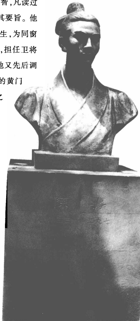
青年陈寿，炯炯双目放射出智慧之光。

炯炯双目放射出智慧之光。铜像的后面，巨大的屏风上镌刻着常璩撰写的《陈寿传》全文。四周墙壁上有陈寿家世及他的治学历程、宦宦生涯、史学著作等图文。陈寿出生于战事频仍的魏、蜀、吴三国鼎立时期，在他没来世上之前，其父已投身军旅，在蜀国大将马谡帐下任参军。街亭之战失利后，他父亲回到家乡安汉，得以同夫人一起教育少年陈寿。陈寿不负双亲厚望，勤学不辍，好问善思，表现出出类拔萃的才赋和终成大器的潜质。大约在后主刘禅延熙年中后期，他以良好的品行和优异的学业，来到成都，进入蜀国最高学府太学。在那里，陈寿夜以继日地阅读先秦经典文献，钻研司马迁的《史记》和班固的《汉书》。他聪敏睿智，凡读过的书简无论如何艰涩，都能过目成诵并记住其要旨。他善于著述，文章构思巧妙，辞采熠熠，议论风生，为同窗中的佼佼者。在太学完成学业后，陈寿入仕，担任卫将军姜维的主簿，典领文书，办理军务。之后，他又先后调任蜀国图书馆秘书郎和侍从皇帝、传达诏命的黄门散骑侍郎。此时的蜀汉政权已每况愈下，加之曹魏大兵压境，正处于危急存亡之秋。而刘禅亲小人远贤臣，致使宦官弄权，朝纲混乱，百姓怨声载道。陈寿因不愿趋炎附势而仕途受挫，心情沉郁，终日闷闷不乐。也就在这个时候，父亲去世，他回家奔丧，料理后事。由于悲伤过度，陈寿一病不起。迫于病情越来越沉重，万般无奈之下，他只好让侍婢帮助调制药丸。此事被乡里所闻，被讥为触犯了“男女授受不亲”的封建戒律，因此仕途更加沉滞，累年不得升迁。延至蜀汉灭亡，陈寿便返归故里，深居于万卷楼里，把先父之嘱托、为官之冤怨、亡国之痛楚深深地埋进书山，沉入墨海，在安汉老家度过了近十年的寒窗生活。