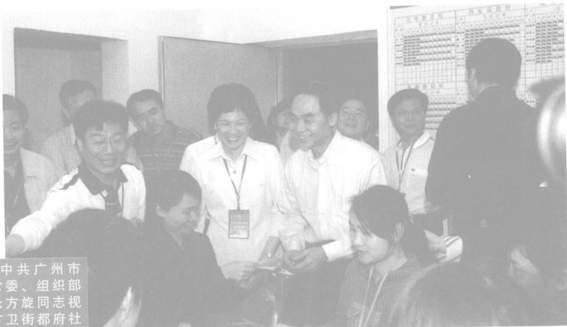
中共广州市委常委、组织部部长方旋同志视察广卫街都府社区党员之家。

随着改革的深入和社会主义市场经济体制的不断完善，党的建设面临着系列新情况、新问题，对流动党员教育管理服务工作提出了更高要求。针对新的形势，我市各级党组织以教育管理流动党员为重点，以搭建服务平台为手段，积极探索流动党员教育管理新模式，取得了较好的实效。