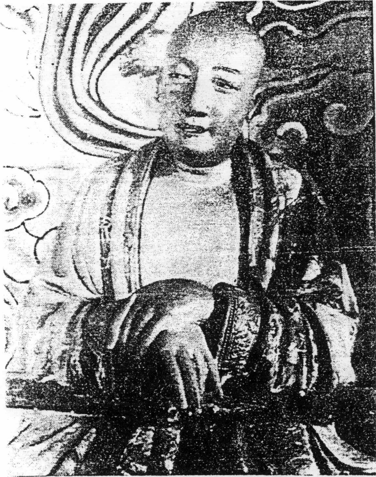
江蘇吳縣紫金庵的南宋羅漢塑像