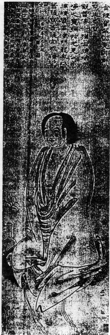
觀音像 清・見月讀體（一六〇一、一六七九）畫