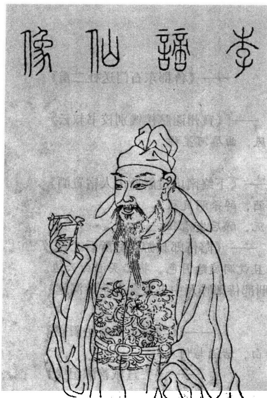
李白像，图出自《吴郡名贤图赞》。

作者：高适（702？—765年），字达夫。渤海蓨（今河北景县）人。早年仕途失意。后客游河西，为歌舒翰书记。历任淮南、四川节度使，终散骑常侍。封渤海县侯。边塞诗和岑参齐名，并称“高岑”，风格也大略相近。