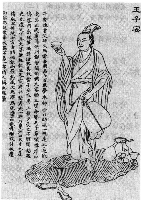
唐代诗人王勃像，图出自清·上官周绘《晚笑堂画传》。

作者：贺知章（659—744年），字季真，越州永兴（今浙江萧山）人。武则天证圣元年（695）进士。累官至太子宾客、秘书监。为人旷达不羁，自号“四明狂客”。天宝初还乡为道士。