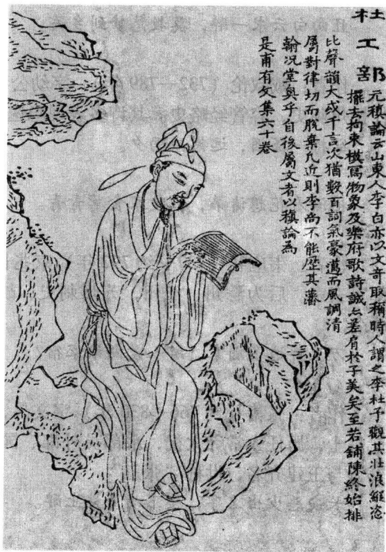
杜甫像，图出自清·上官周绘《晚笑堂画传》。