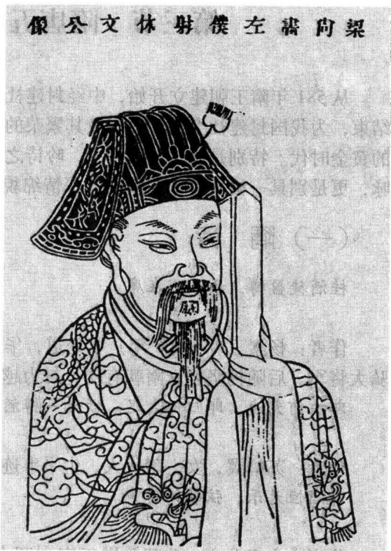
沈约像。沈约为南朝诗人，以诗多且工整精致而著称。

作者：范云（451—503年），南朝诗人。字彦龙，南朝舞阴（今河南泌阳北）人。范缜从弟。年少即能赋诗，兼善属文，下笔成章。官