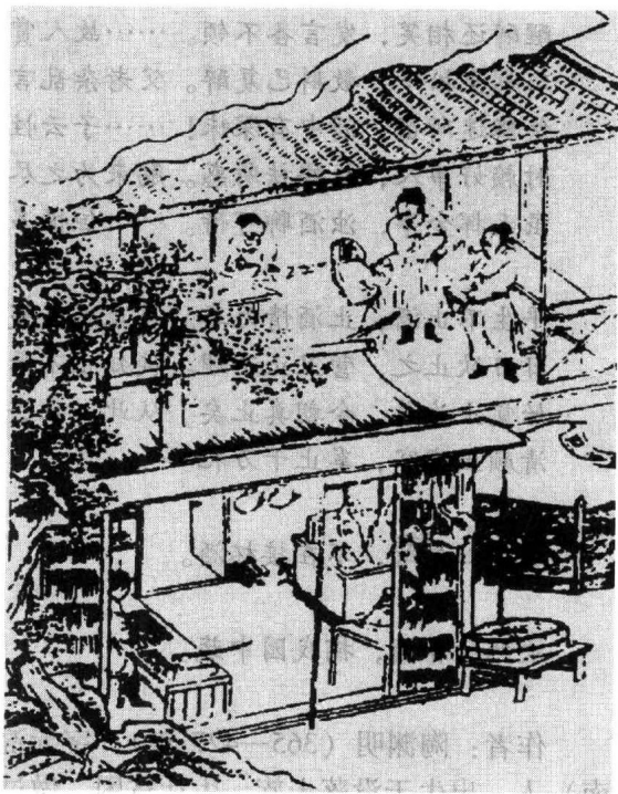
荆轲与高渐离饮于燕市图