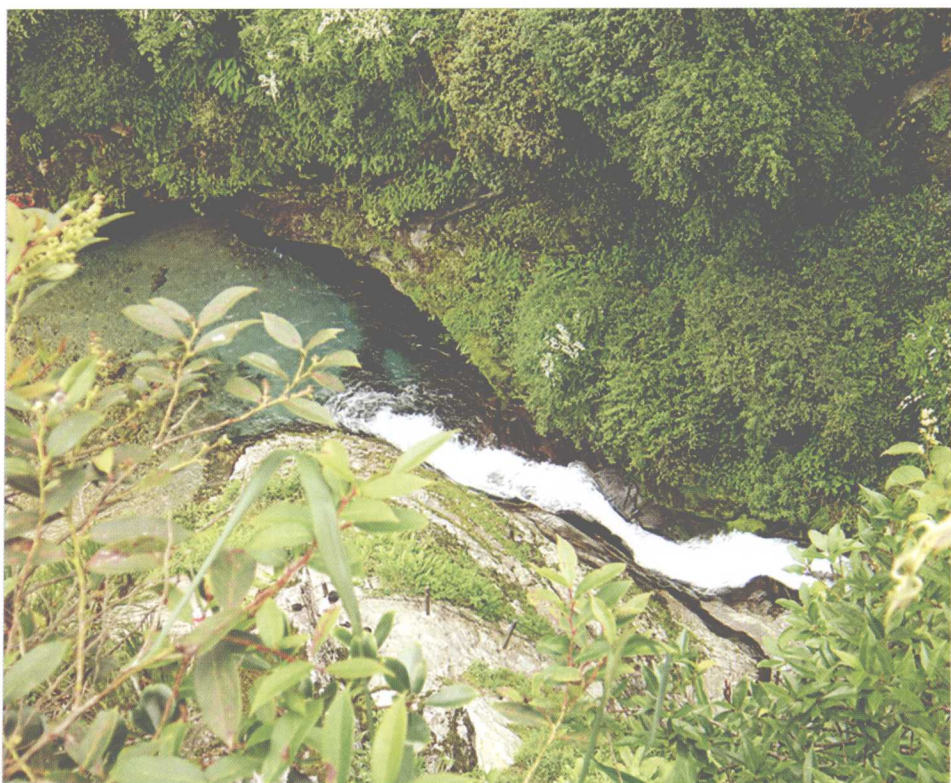
高山深涧，云南山间的美丽景色

精心培育的云抗10号、14号为国家级优良品种，长叶白毫、云梅、云抗43号等为省级良种，近几年推广至西双版纳、临沧、保山、德宏等主要茶区。做普洱茶的适合品种，以茶的内含物中作为氧化、