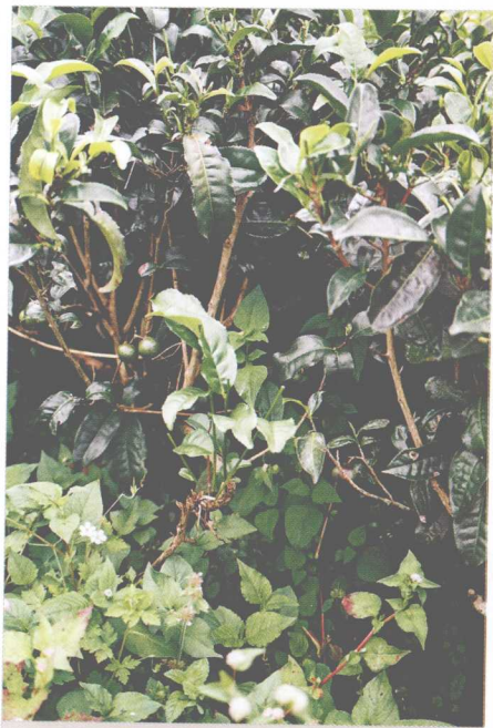
未施撒除草剂的生态茶园，茶树间杂草丛生

中国官方于1951年设立云南省茶叶科研所，现保存云南大叶种茶树资源607份，为中国第一个茶叶数据库，也收集有全世界所发现的现有茶种。另于1985年成立的云南省思茅茶树良种厂，是云南大叶茶良种繁殖推广中心。