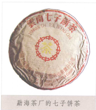
勐海茶厂的七子饼茶

与沱茶起源相同，由团茶演变而来。原先销至西藏的团茶因长途跋涉时常产生发霉现象。佛海茶厂于民国元年至六年（1912~1917）将团茶改为带把的心脏形，取名宝焰牌紧茶。宝焰牌紧茶全为手工团揉精制，每个净重238克，七个为一筒。1967年改为长方形砖片，采用机器压制，每片重250克，用中茶牌商标。因班禅大师的重视，下关茶厂于1986年恢复生产心脏形藏销紧茶至今。