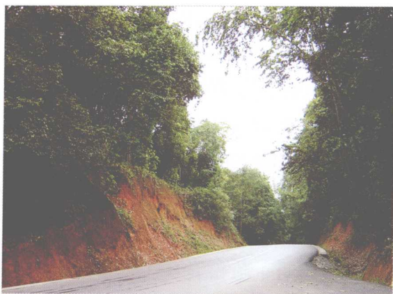
植物王国的红色土壤，茶树和各种植物都赖之生存繁衍

今三百多年前，由西双版纳引种至勐库，遂有现今的勐库大叶种。而景谷大白茶是勐库茶的变种茶籽所育种而来。临沧地区的风庆，于明朝开始从普洱引进俗称的“小普洱茶”，清朝末年又从勐库引进勐库大叶茶。现今临沧地区为云南最大茶叶产区，也