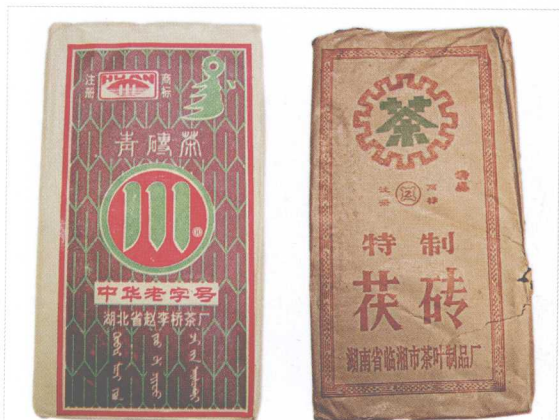
湖北青砖、湖南茯砖茶，长期以来都是大宗边销茶叶

每一种茶都有其历史地理环境背景，以及特有的香气口感。笔者个人认为，所谓云南普洱茶，应为：云南所产晒青毛茶与其紧压成品，且未经高温杀青、干燥、烘焙，干净存放的后发酵茶。以这个基调来谈普洱茶，应该就能厘清市面上的误导观念。然而，必须强调的是，并非说广云贡饼、六安茶、六堡茶、千两茶、黑砖等不是好茶，而是说其并非传统定义之云南普洱茶。