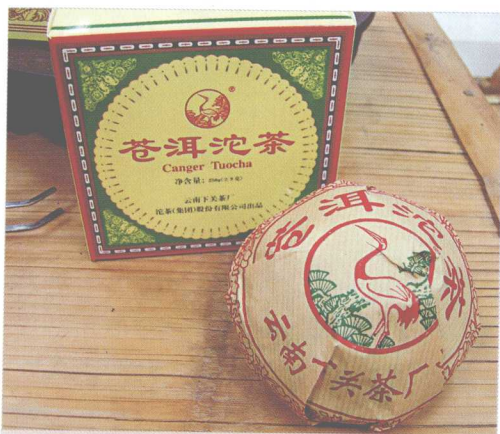
沱茶，又被茶人称为“窝头”。这是下关厂的苍洱沱茶