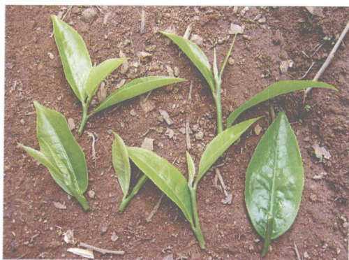
大叶种野生茶树的嫩芽

聚合反应基质的茶多酚与氨基酸越多，保留儿茶素、茶黄素、茶红素也越多者较适合。除了上述之外，易武绿芽茶、元江糯茶、云选9号、矮丰等也被许多精制厂视为适合品种。几经研究发展，当时的一些良种茶，近年逐渐被淘汰（如云抗10号），而