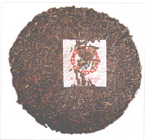
勐海茶厂80年代生产的青饼

地区。大部分在北回归线以南，属于热带亚热带高原型气候，日照充足，年平均温度摄氏17~22度，年平均降雨量1200~2000毫米之间，相对湿度在80%以上。土壤以砖红壤与赤红壤为主，PH值4.5~5.5之间，疏松腐质土深厚，有机含量特高。