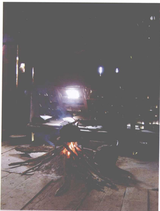
西双版纳少数民族高脚木楼一角——木柴铁壶，煮水烹茶

普洱茶的制作，严格说来并无一定且明确的工序。许多厂志与官方资料都说明了普洱茶的工序为何，然笔者为何说“无明确工序”之言？以前云南各国营厂（昆明、勐海、下关等茶厂），是以大型厂房与机械化来克服天候的不稳定，然少数民族制茶并无杀青滚筒、揉茶机、干燥烘房等，以大铁锅杀青，晒青、干燥等都依赖日光或