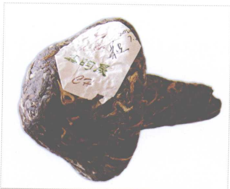
紧茶，也被人们称为“香菇头”

明、清时期随着普洱茶的兴盛，广为人们所接受，普洱茶种植地区除西双版纳与思茅地区外，也开始不断向外扩大引种繁殖。距