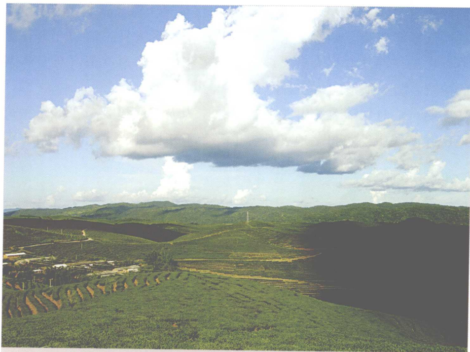
茶山：蓝天，白云，亮丽的阳光，葱郁的茶树

明、清以来普洱茶的兴盛造就了普洱产区的扩大，由古代原始的澜沧江流域扩展到滇西的保山怒江流域，滇东南的红河文山等地。