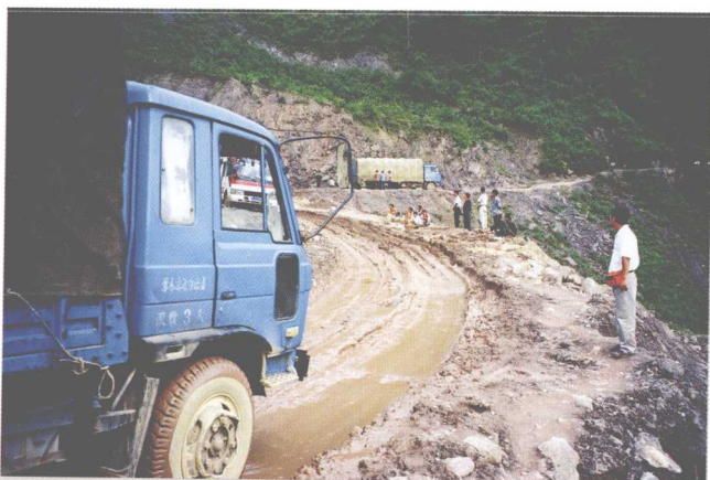
云南山区恶劣的交通条件，是制约当地工农业生产和经济贸易的最大障碍