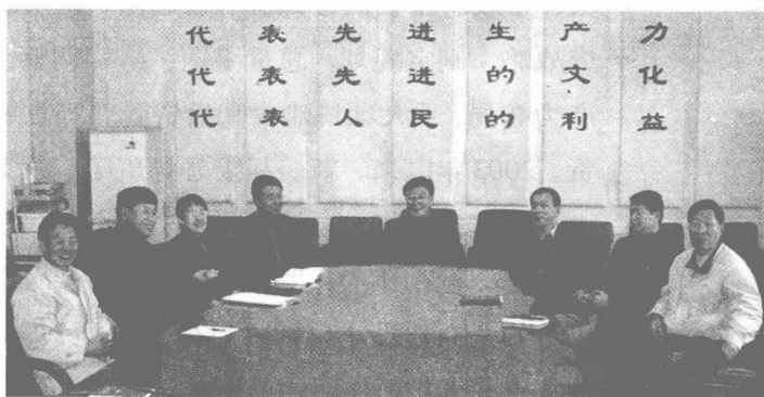
2003年11月，沈阳市发展计划委员会领导班子部分成员在研究部署工作

的影响及对策》、《关于我市项目年经济效果评估及后五年发展远景预测》等重大调研课题。与市委督察室、市政府办公厅督察室和市项目办联合对全市上半年项目年工作 & 利用外资进展情况进行了专项督察，形成了《全市项目年活动进展情况及建议》督察专报。2003年以来，共完成30余项专项规划和专题调研报告，及时