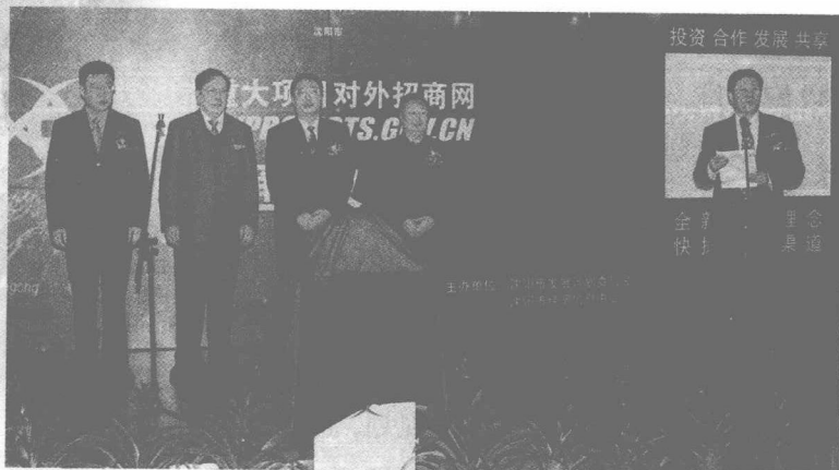
沈阳市重大项目对外招商网开通仪式

重点项目进展顺利。 2003年，全市共开工建设3000万元以上项目442个，总投资1061.2亿元。在这些重点项目中，沈飞日野客车项目已竣工投产，法库风力发电一期工程12台风力机组已于3月底开始并网发电，沈阳第一制药厂整肠生生物制剂、三洋空调新冷酶技术改造、橡四军用胶布和航空薄膜改造及沈阳金石豆业深加工、宝马汽车等一批项目已竣工。新民永一纸业一期工程、鞍钢板材配送中心项目、华润压缩机四期改造等一批项目年内将竣工投产。红网科技、SIN—LCD液晶屏生产、