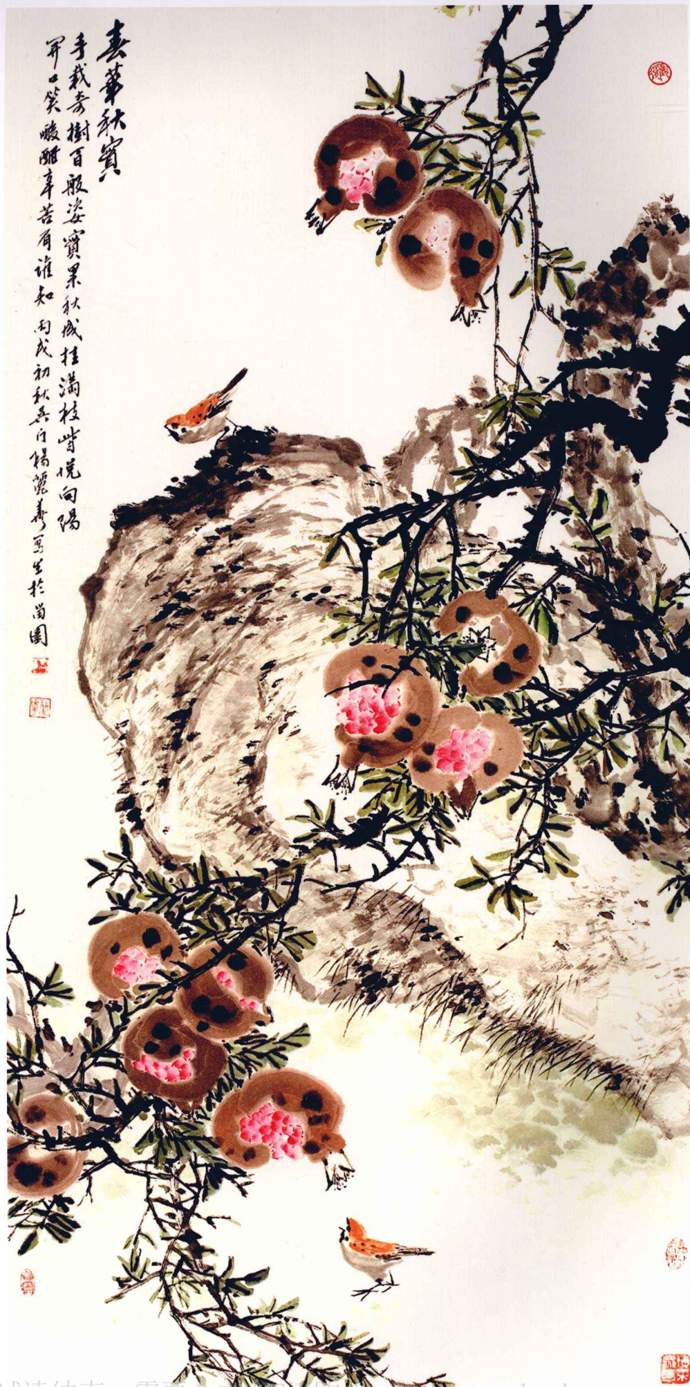
春华秋实 136cm x 68cm

手栽秀樹百般姿，實果秋成挂滿枝。 嘗說向陽爭一第，酸醃身苦有誰知。 初秋吳白楊畫於苗圃