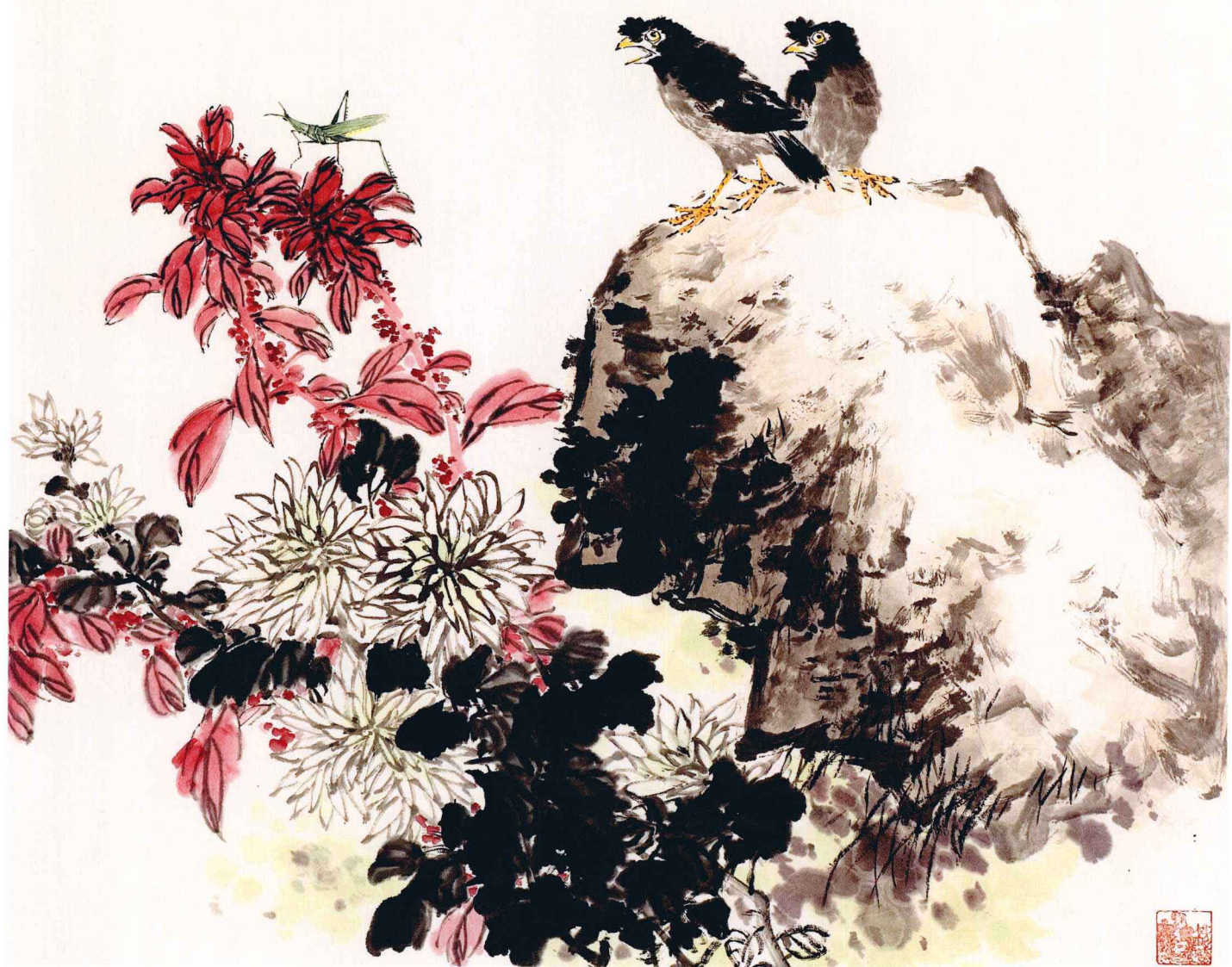
秋光烂漫 136cm x 68cm

自 逢 秋 悲 寂 寥 我 言 秋 日 胜 朝 暮 雨 成 其 日 杨 麗 华 写 于 二 松 雨 窗 并 记