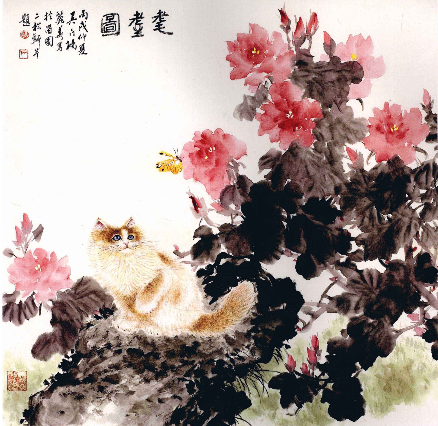
笔墨图 68cm x 68cm