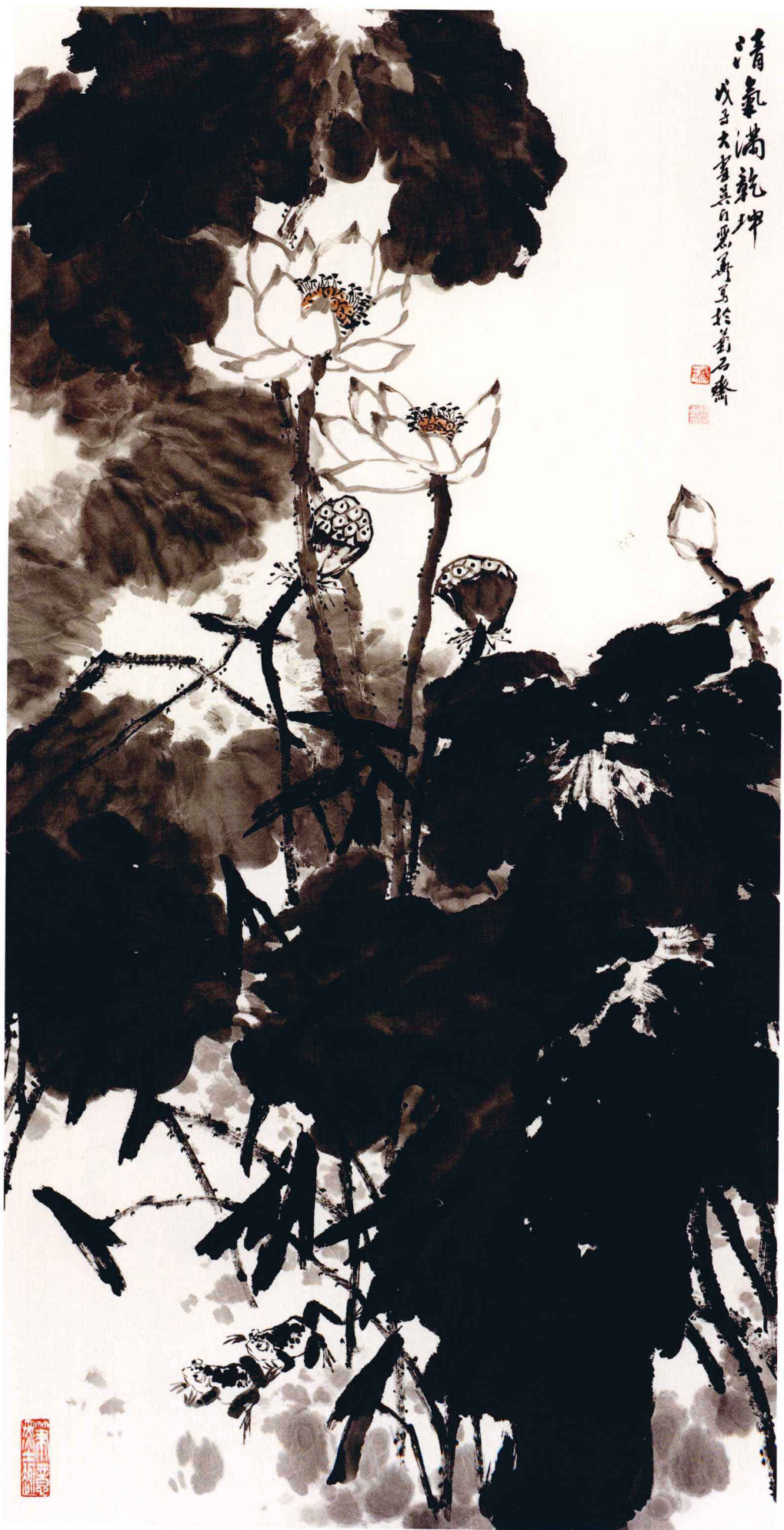
清氣滿乾坤 136cm x 68cm