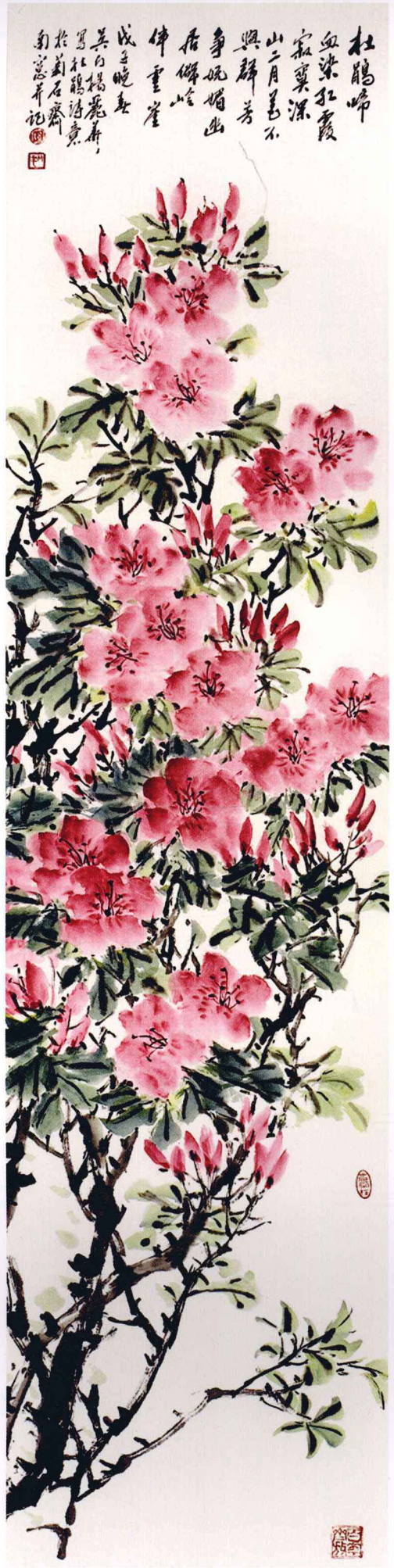
杜鹃红似火 136cm x 68cm x 4