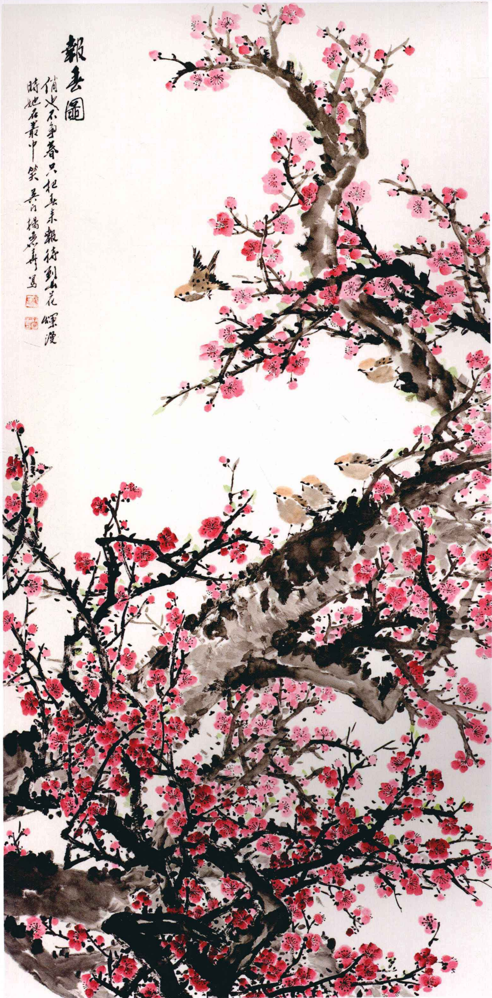
报春图 136cm x 68cm