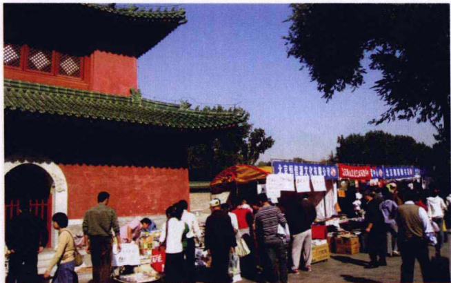
每年举办的地坛书市总会吸引大批的市民前来购书