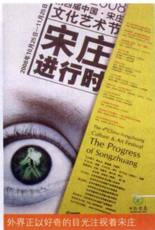
外界正以好奇的目光注视着宋庄