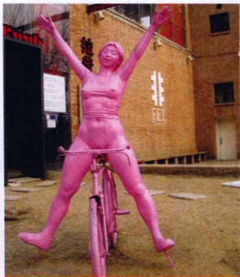
798艺术区内的“女青年”

2004年，聚集在798艺术区的艺术家们自发举办了第一届“大山子国际艺术节”，在成功举办三届后，2007年艺术节变更为“798艺术节”。艺术节每年9月底在798艺术区举办，为期3周左右的时间。