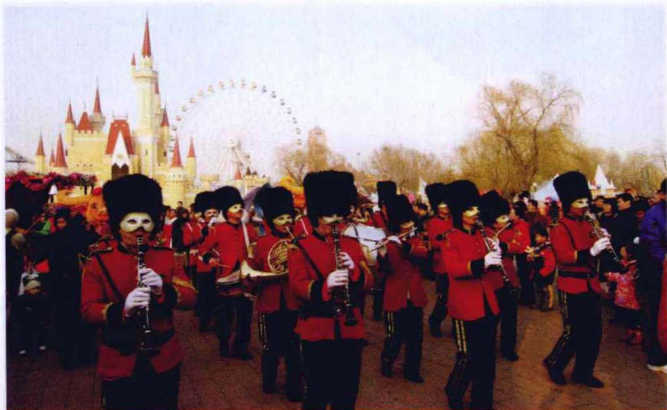
每年春节期间，石景山游乐园都会举办具有异域风情的洋庙会

大愿祈祷法会，又称善愿日，是藏传佛教格鲁派寺院的重要节庆。正月二十三日至二月初一日为法会日期，其中正月二十九日、二月初一日两天要跳金刚驱魔神舞，金刚驱魔神舞即百姓所说的“打鬼”。舞蹈以西藏土风舞为基调，吸收了西藏苯教仪轨和印度瑜珈面具舞的某种形式而形成，为藏传佛教的一种宗教舞蹈。