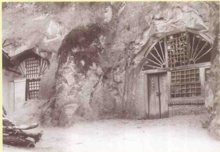
光华印刷厂成立初期旧址