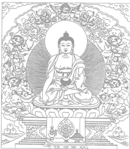
图一 佛教共祖释迦牟尼世尊

可举一喻,譬如医生,分内外科、五官科、心脏科等等,盖亦各适其适,医治不同的病人耳。若谓医生多事,何不一人兼习全科,能