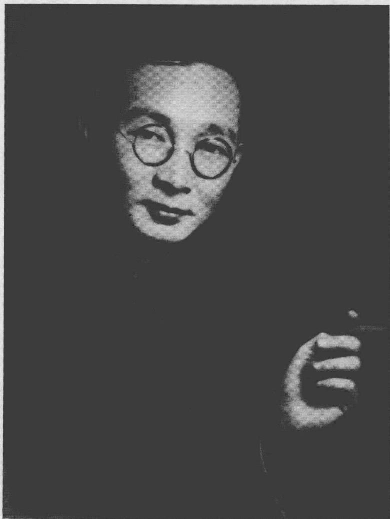
Lin Yutang, about 1936 (Original size: 18.5cm×24.5cm)