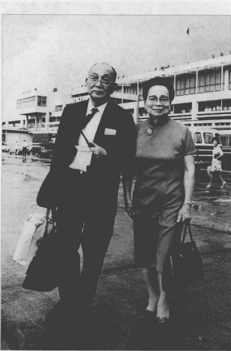
The Lin couple at the airport in Taiwan, 1967 (Original size: 12.5cm×17.4cm)