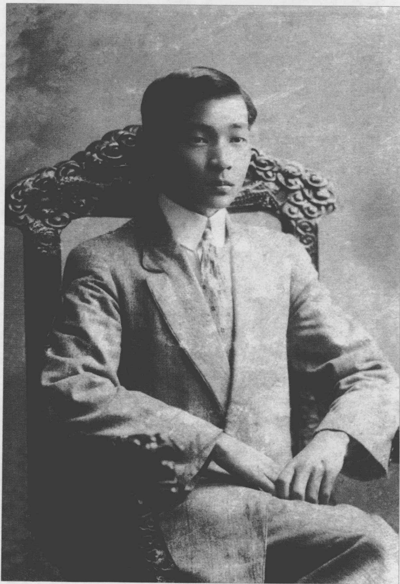
Lin Yutang just arrived at Shanghai for his further education.