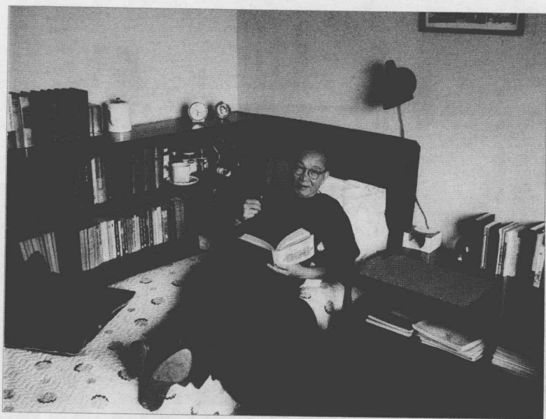
Lin Yutang at home in New York, about 1960 (Original size: 12.8cm×10.2cm)