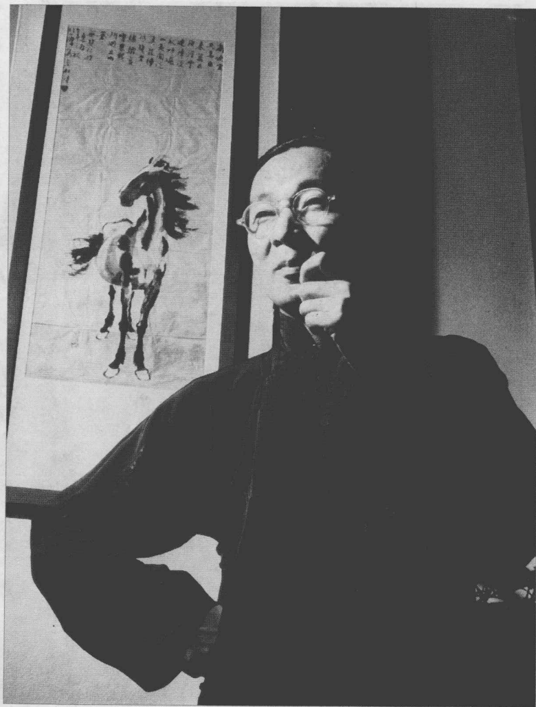
Lin Yutang stood in front of Xu Beihong's painting The Horse in New York, about 1940. (Original size: 19.3cm×24.3cm)