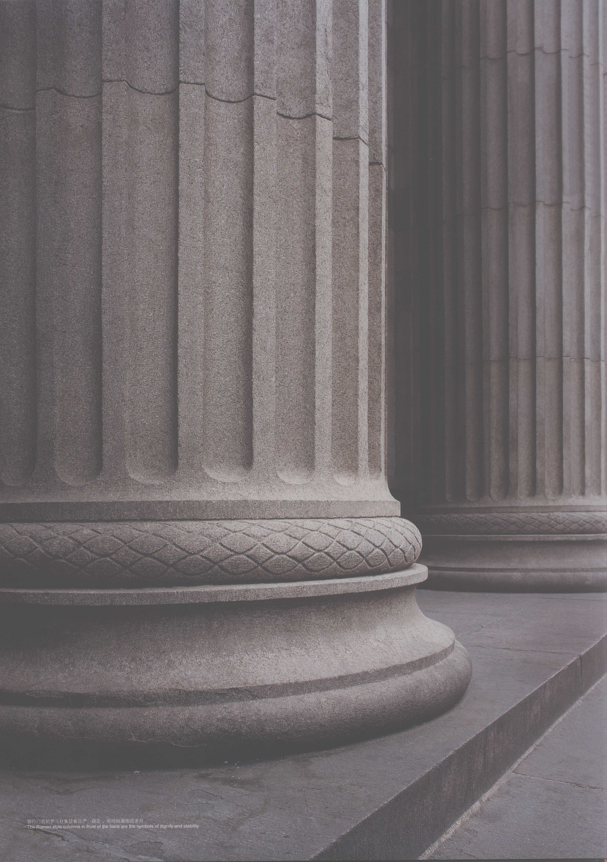
银行门前的罗马柱象征着庄严、稳定，将时间凝固成岁月 The Roman-style columns in front of the bank are the symbols of dignity and stability