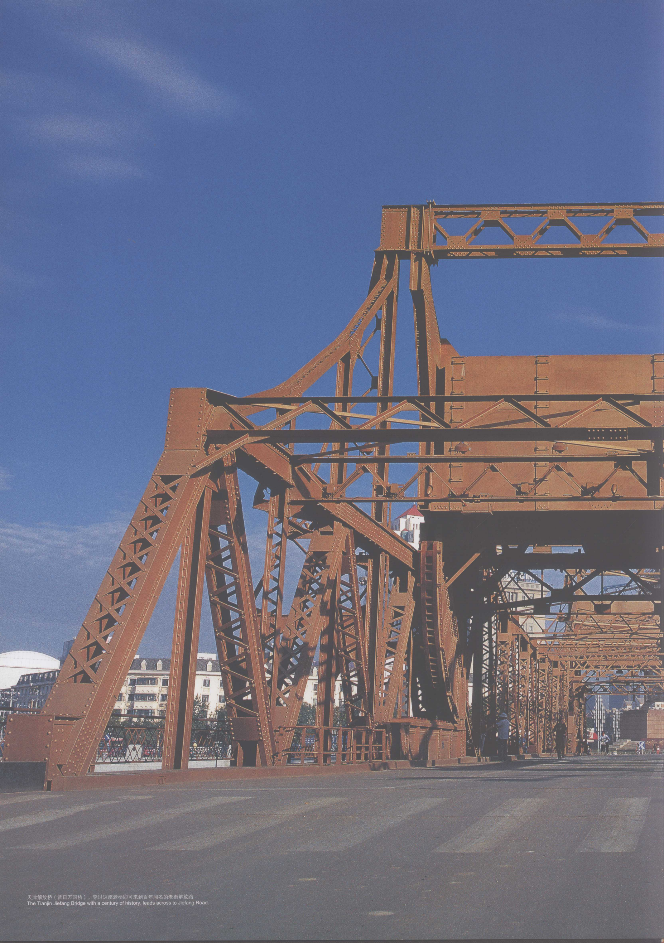
天津解放桥（昔日万国桥）。穿过这座老桥即可来到百年闻名的老街解放路。 The Tianjin Jiefang Bridge with a century of history, leads across to Jiefang Road.