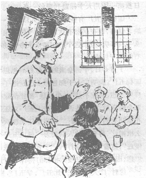
第一織布車間主任終於站起來發言之了。

“你們都有決心，我們也有決心以一年時間趕上國棉五廠織布車間！”第一織布車間主任終於站起來發言之了。大概是因為過於激動的緣故，他的雙手和嘴唇在微微顫抖。停了一停，他又接着說：“我們保證下機正品率在第一季度達到55%，第二季度提高到70%，第四季度達