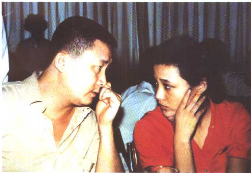
1979年作者与陈冲摄于上海