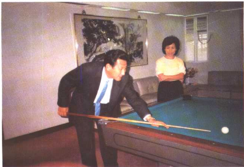
1990年北京市副市长张百发于作者寓所