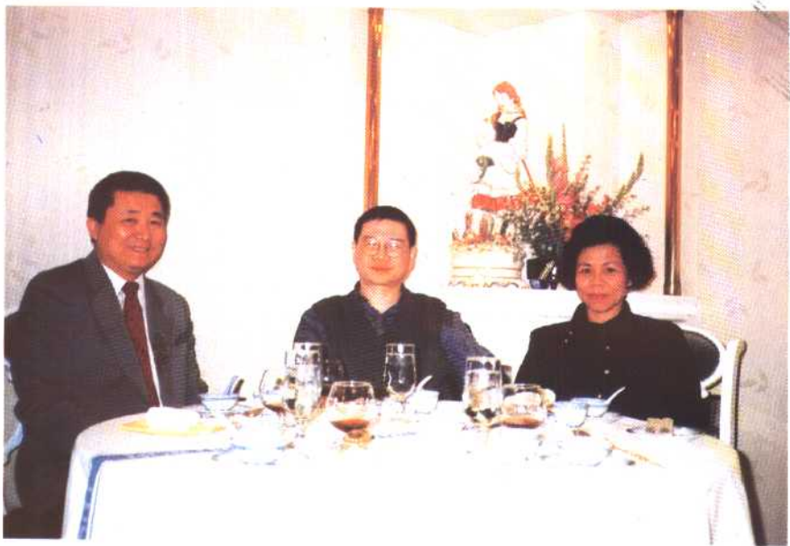
作者与香港著名作家倪匡合影