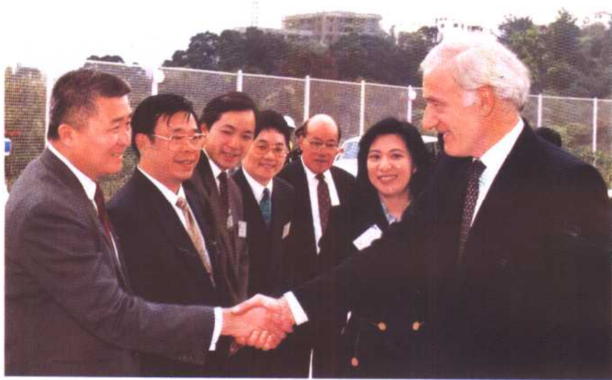
作者与香港总督在一起