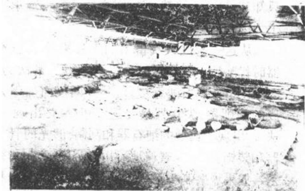
图 1-2 半坡遗址

的新技术，将小石珠、小砾石、兽骨、兽牙、鸟骨、鱼骨等磨光、钻孔，有的还用赤铁矿粉染成红色，用皮条穿起来，用做身体的装饰品。他们还磨制了骨针，用兽皮缝制衣服，来遮蔽身体。这都说明，山顶洞人已经有了爱美观念。山顶洞人还在死去的家族成员的尸体周围撒上赤铁矿粉粒，并陪葬一些装饰品，说明他们产生了原始的宗教观念，相信人死以后还有灵魂存在。