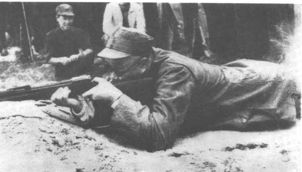
一九四六年六月练兵会议时带领 纵队、旅领导同志打靶。