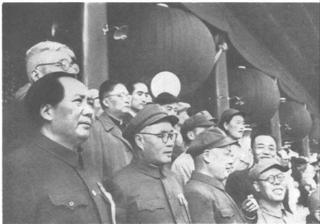
在天安门上参加开国大典