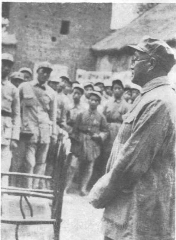
一九四八年华东野 战军慰问中原野战军 时，向华东野战军慰问 团同志讲话。