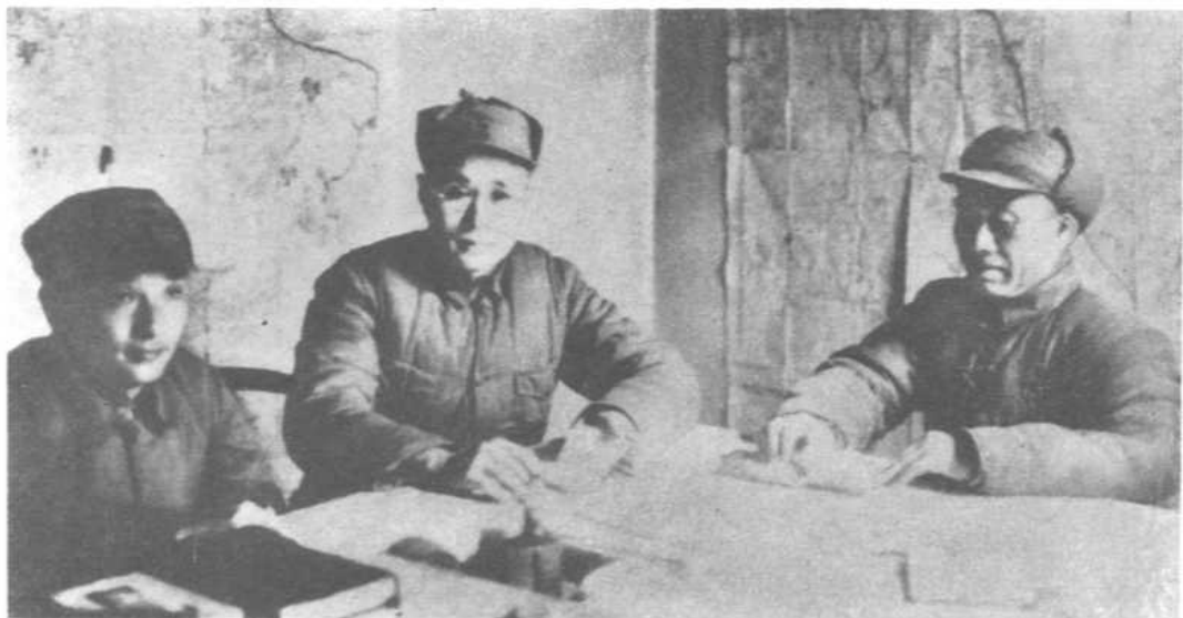
在太行山抗日前线 与朱总司令、邓小平政委合影。