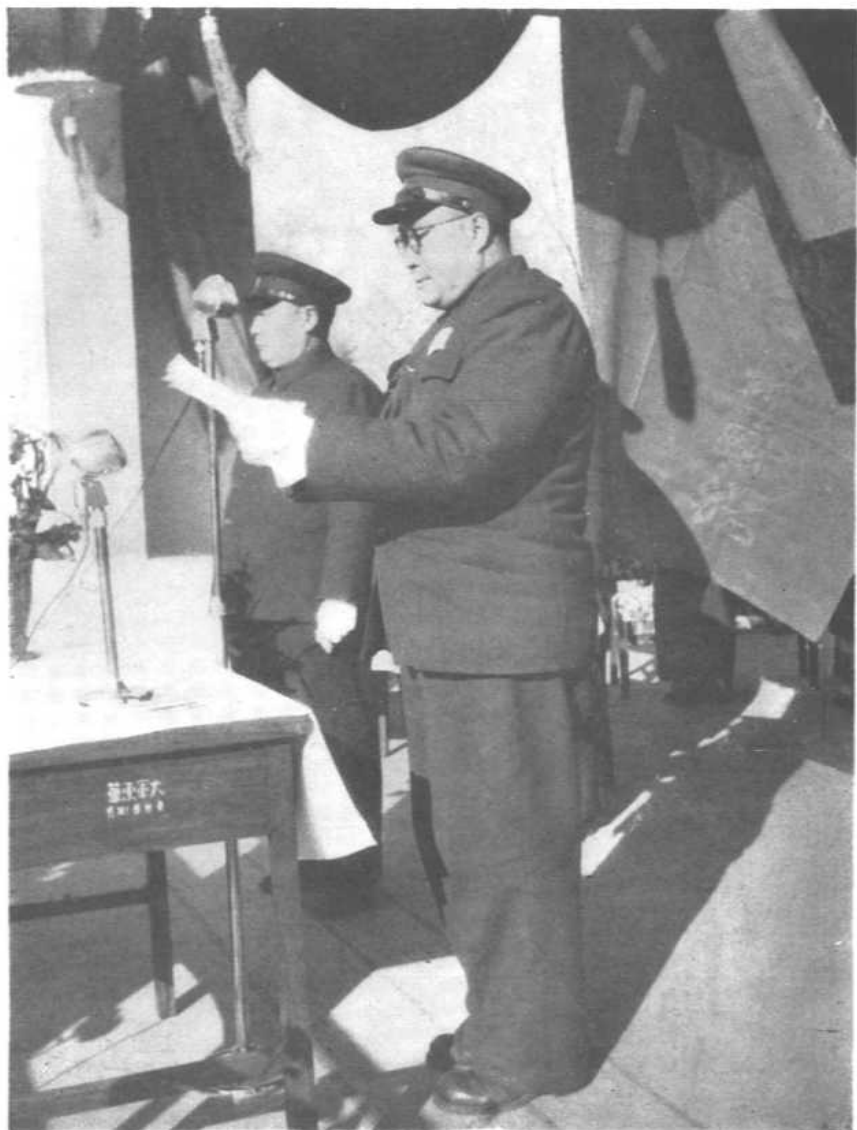
在军事学院成立典礼大会上接受校旗后讲话，旁立者为中央军委代表陈毅。