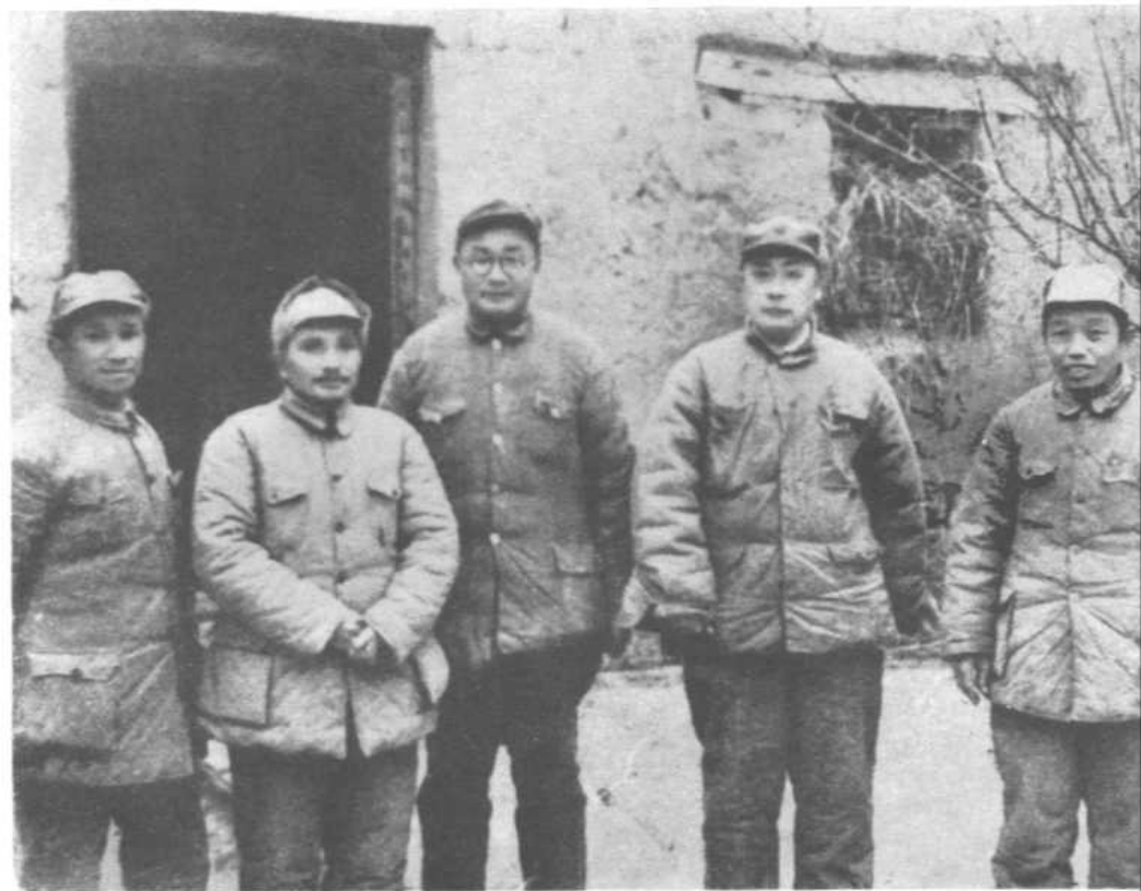
淮海前线总前委合影