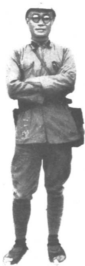
红军时期任中国工农红军总参 谋长、红军大学校长。