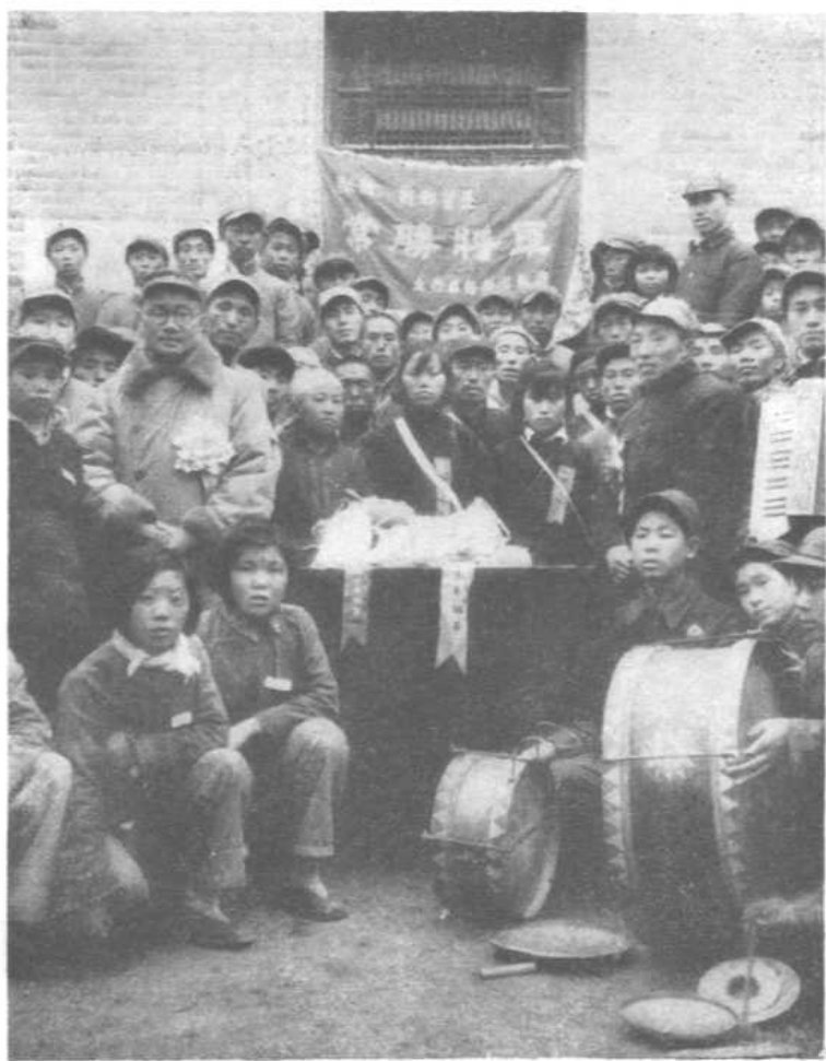
解放战争时期，在豫 北前线与太行慰问团合影。