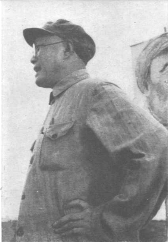
一九四九年在中原 纪念南昌起义二十一周年 大会上讲话。