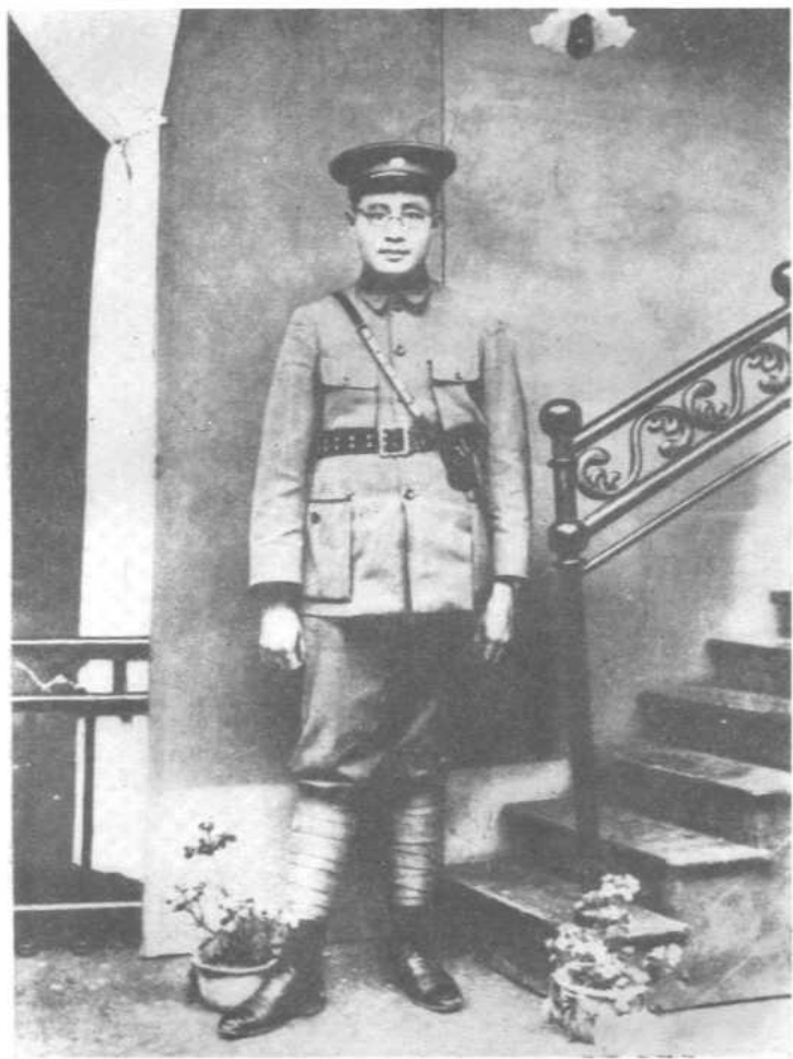
第一次国内革命战争时期任国民革命军第十五军军长，四川各路总指挥