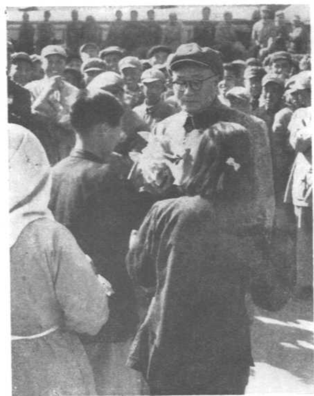
进军大西南途中在郑州车 站与群众见面