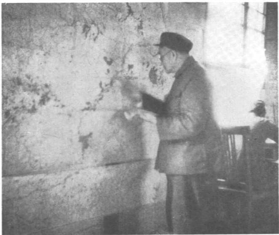
一九四九年指挥渡江 作战时在作战室