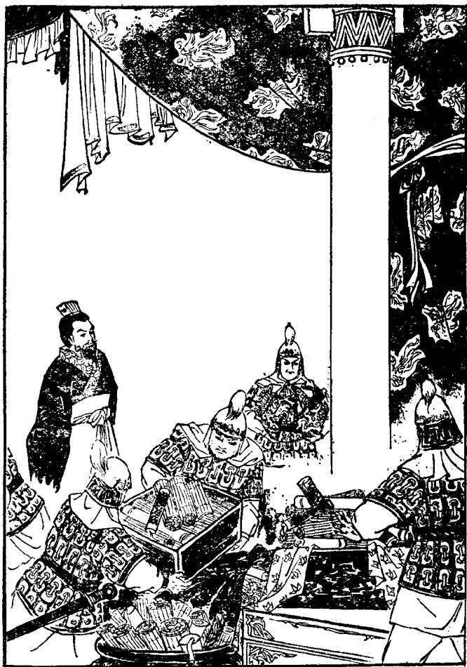
萧何收集律令图书