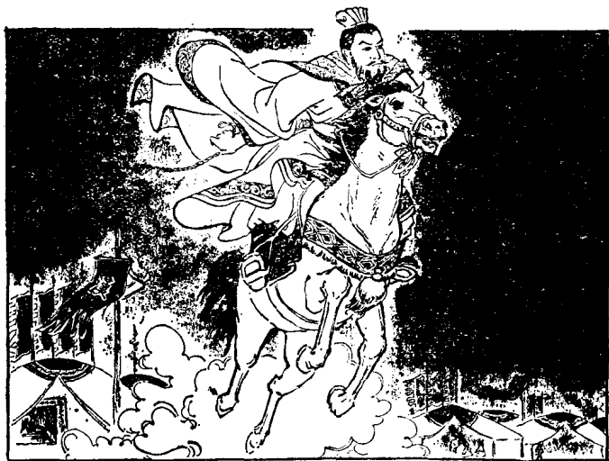
萧何听说韩信不辞而别，就急忙亲自追赶

萧何曾与韩信几次长谈，十分器重他的才干。当时，中途逃亡的将尉已经有几十人，韩信估计萧何已经向刘邦推荐过他，却仍然不被重用，便决定离去。萧何听说韩信不辞而别，来不及向刘邦打个招呼，就急急忙忙亲自追去。有人报告刘邦说：“萧丞相跑了。”刘邦大发雷霆，慌得不知如何是好，就好象失去了左右手似的。过了一两天，萧何来见刘邦，刘邦又喜又怒地骂道：“你是不是也想跑？”萧何说：“我不敢跑，我是去追跑的人。”刘邦问他：“你追谁？”萧何答道：“追韩信。”刘邦又