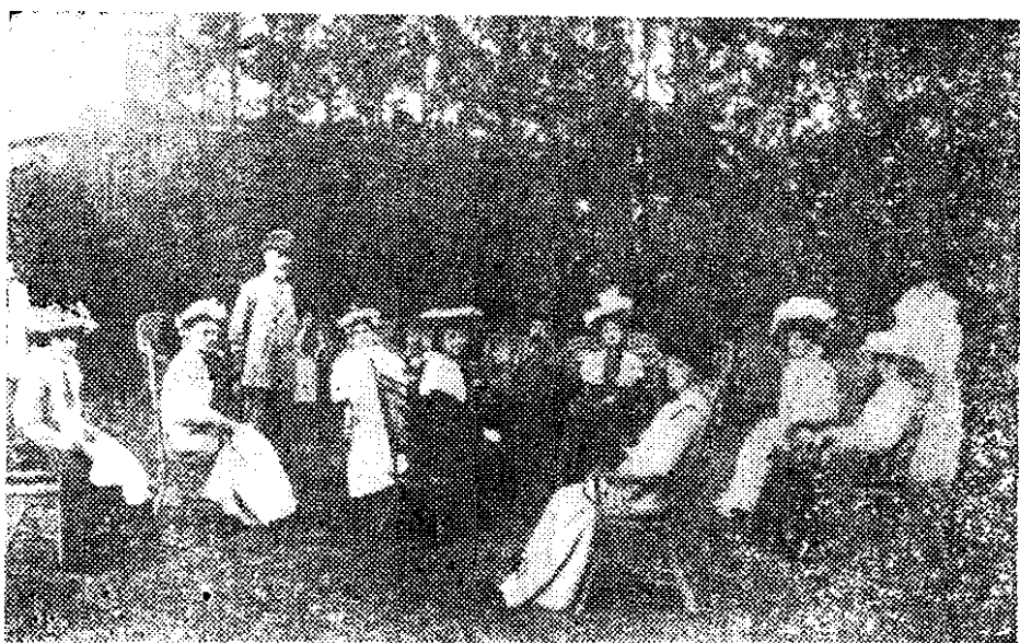
1882年夏，赫德在其花园内招待来华德国水师提督都沛禄文与德国外交官穆默等客人。