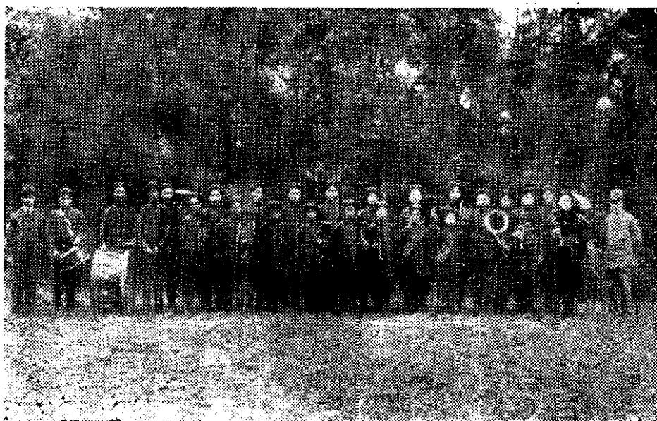
赫德及其铜管乐队