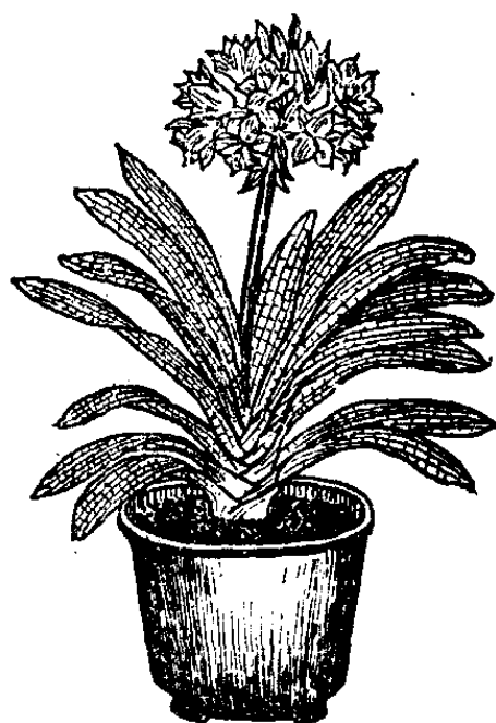
图 1 君子兰

种子成熟即可采收并及时播种。播种方法是用盆浅或木箱盛装细沙，把种子种脐朝下摆放在细沙表面，覆沙 0.5—1.5 厘米，用细孔喷壶缓缓浇水，以免冲走沙子。第一次水要浇透，以后每天轻轻浇水。播种后盆上盖玻璃片或塑料薄膜，放在温室里或屋内火炕、火墙上，但应防止过热。室温保持 20℃ 左右，40—50 天即可发芽。