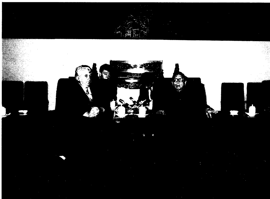
▲1992年11月23日,任建新院长会见罗马尼亚最高法院院长——博格达·内斯库先生一行。