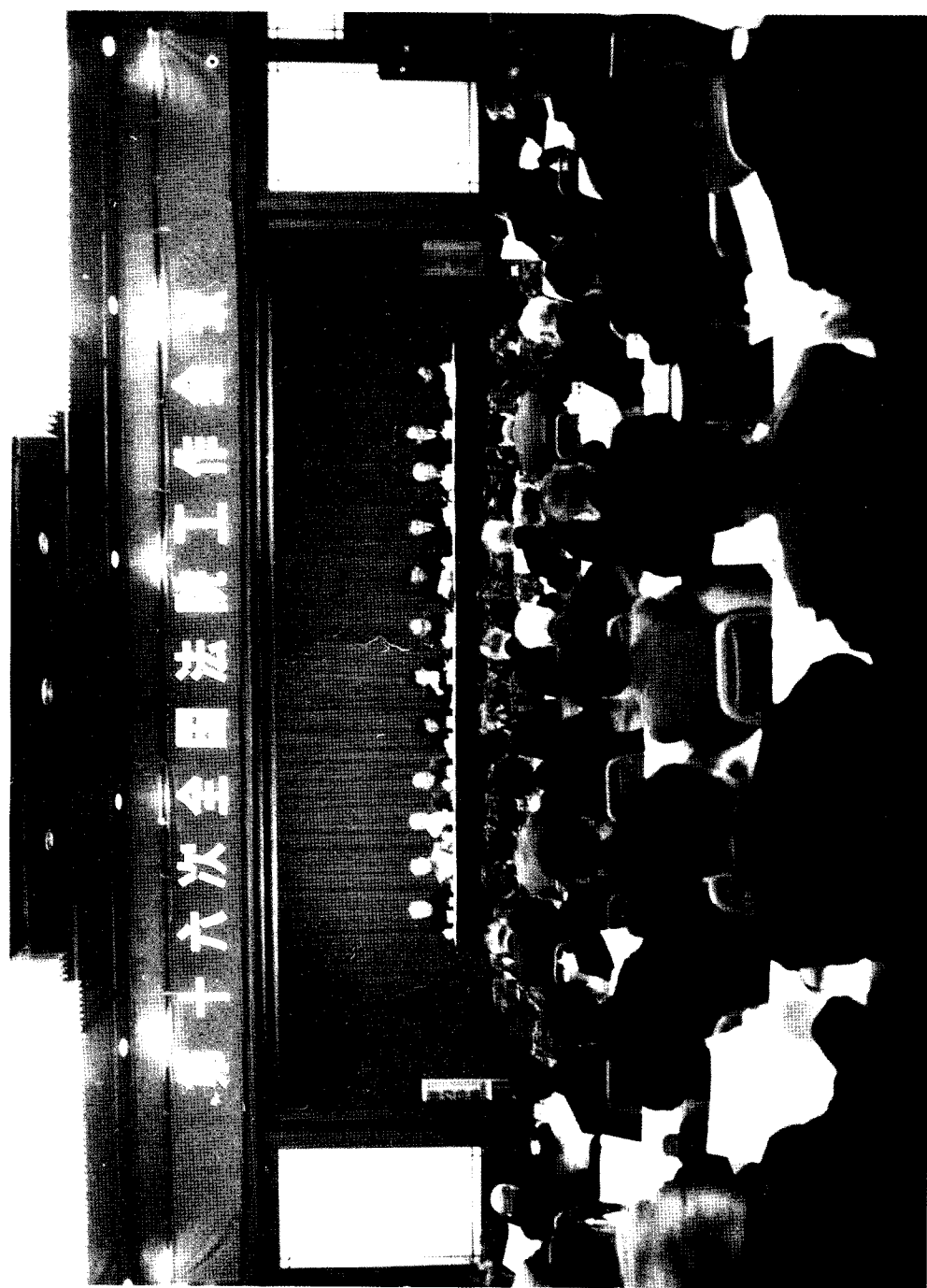
▲ 1992年12月20日，第十六次全国法院工作会议在北京隆重召开。