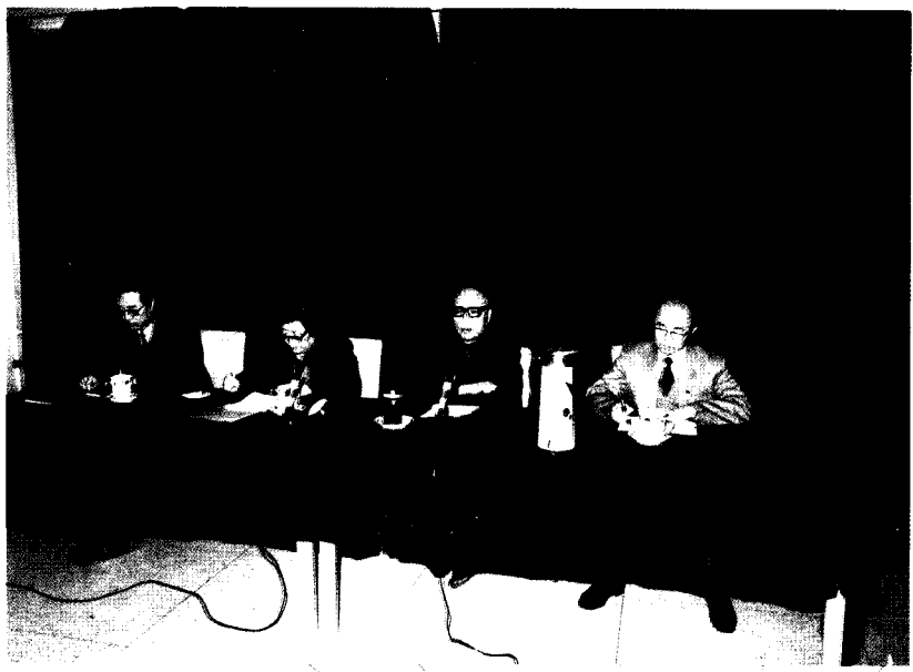
1952年1月30日，最高人民法院与人民日报联合举办「法官风貌」有奖征文。图为全体评委合影。