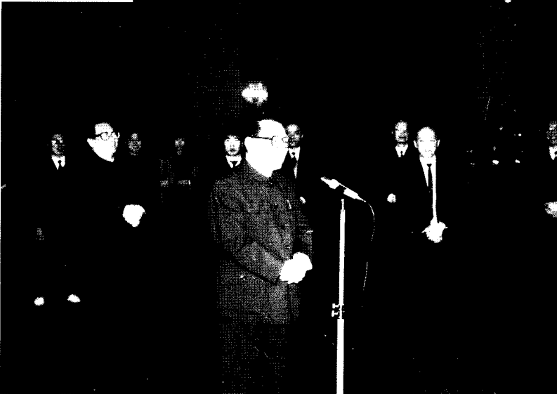
▲ 1992年12月26日,中央领导同志江泽民、李鹏、乔石接见参加第十六次全国法院工作会议的代表,并分别作了重要讲话。