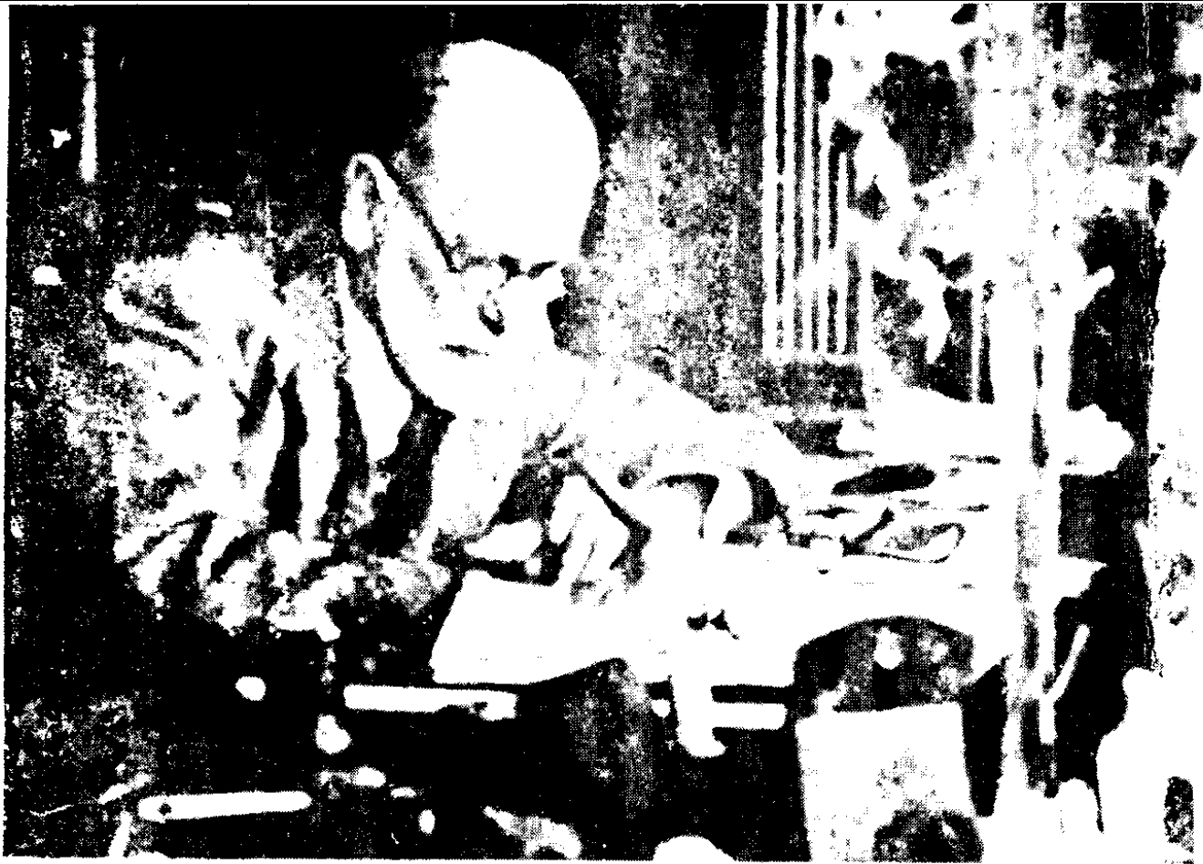
在書齋裡工作的佛洛伊德博士(Sigmund Freud, 1856~1939)。 1938年攝於倫敦。