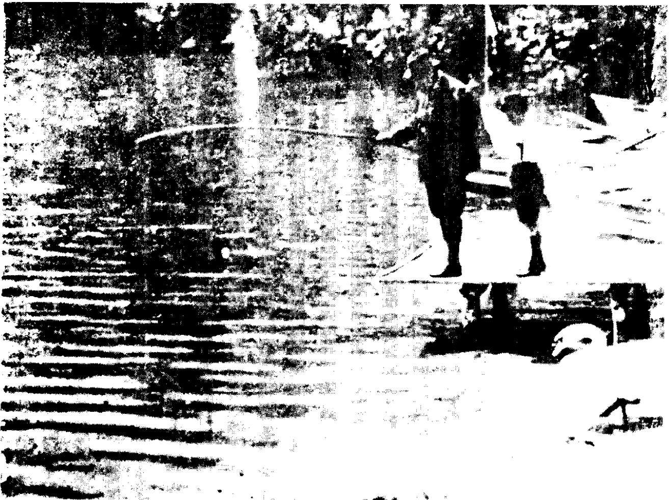
佛洛伊德利用暑假跟他最小的兒子愛倫斯特到河邊釣魚。