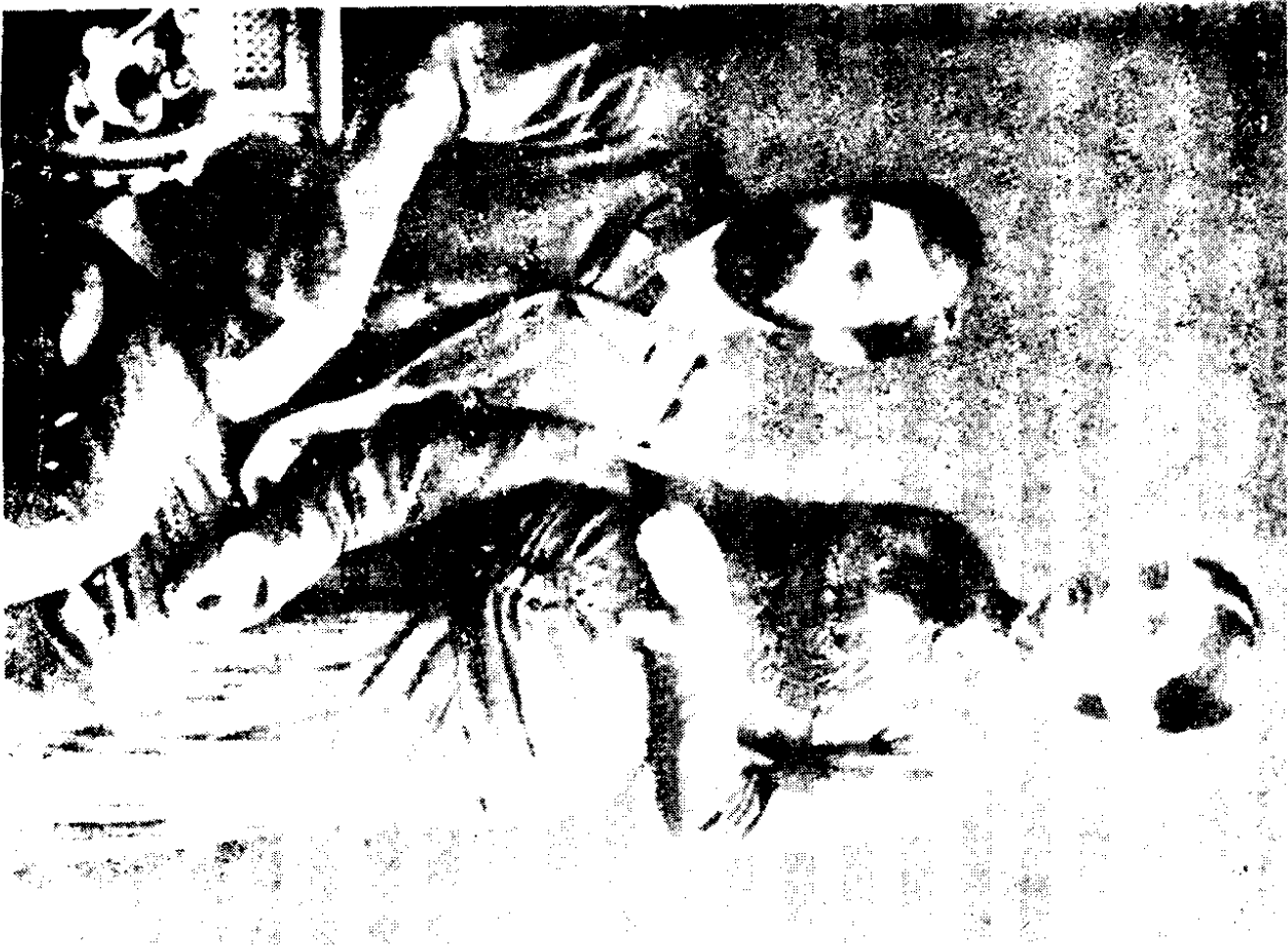
佛洛伊德與其妻子瑪莎合影。